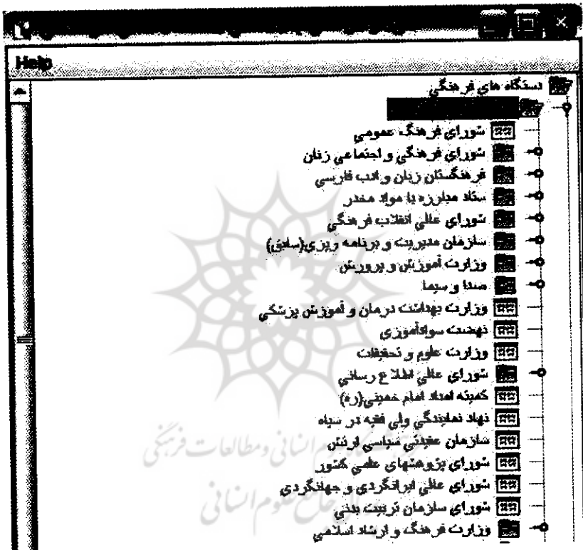
تصویر ۳. نهادهای فرهنگی سیاستگذار

طبق این نمودار می‌توان با کلیک کردن روی هر یک از پوشه‌ها نهادهای فرهنگی مرتبط را مشاهده کرد. برای مثال با کلیک روی پوشه نهادهای سیاستگذار فهرست آن به صورت تصویر ۳ مشاهده می‌شود.