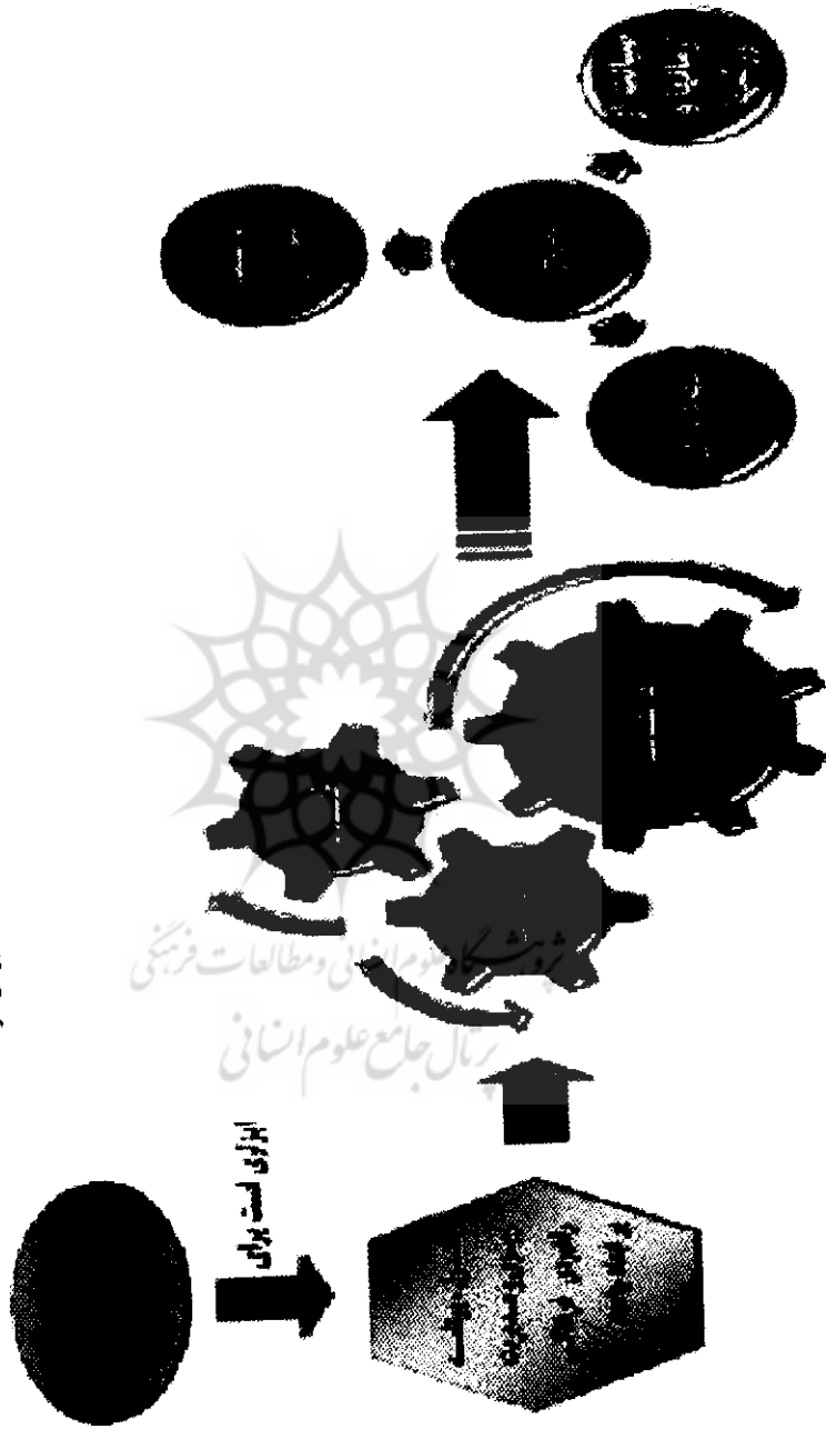
شکل ۱. پیوست فرهنگی ضرورتی جدی برای مدیریت راهبردی فرهنگ