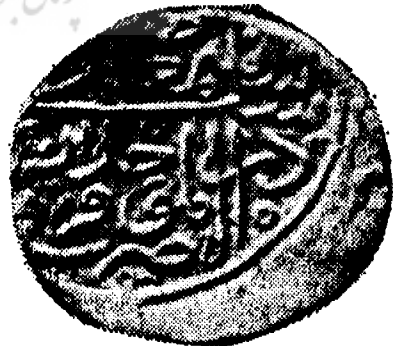
این سکه نیز ضرب دارالموحیدین قزوین و در کتاب رابینو بشماره ۱۳۴ آمده است