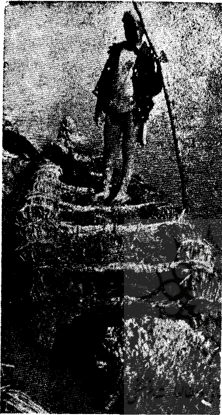
نمونه يك توتین

توتین که لبه ندارد و با چوبی که ته آب بر زمین فشار داده میشود بر روی آبهای آرام نیزار حرکت می کند (۱). آب نیزار هامون گاه کم و گاه زیاد میشود. فصل بهار آبش زیادت و هنگام