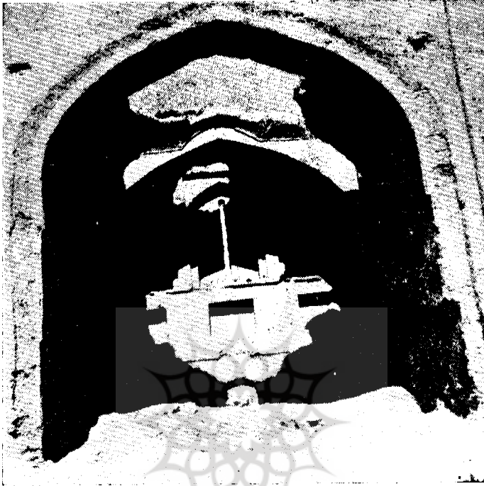
نمای طاق یکی از بنا های قلعه رستم

بیشتر میتوان حدس زد آنست که تغییر مسیر هیرمند باید سبب ویرانی آن شده باشد ، زیرا اکنون شیب رودخانه هیرمند از این شهر خرابه ده فرسخ فاصله دارد .