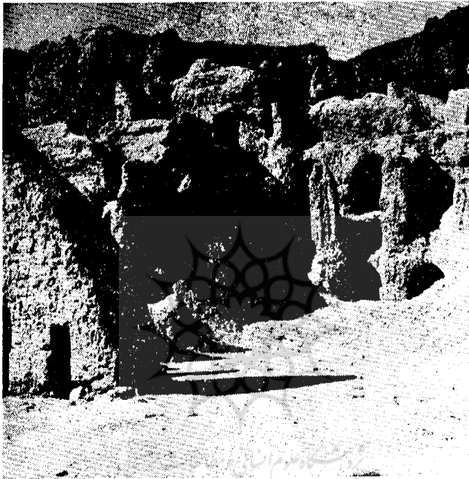
قسمت مرکزی گوان کجهازاد

مرسوم چنین است که صاحب نیازنیت می‌کند و کس دیگری برای آن قبر بر پشت می‌خواهد ، اگر حاجت آن نیت کننده روا شدنی باشد آن مرد خواهم خود بخود از بالای آن محل به پائین در می‌فلطد و اگر حاجت روا شدنی نباشد حرکتی در او مشهود نخواهد شد این بنا در قسمت شمال غربی کوه واقع است و شید نام‌خواجه که به کوه داده‌اند از نام همین زیارتگاه گرفته شده باشد .