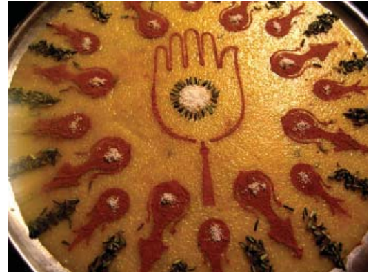
تصویر ۲۷- نمایشگاه عاشورا، موسسه صبا، تهران، ۱۳۸۵