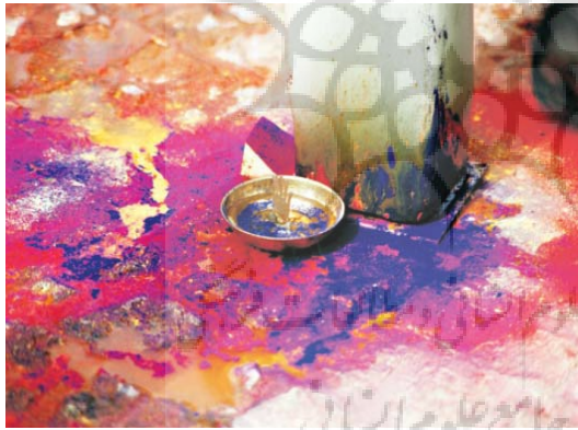
تصویر ۲۹- نمایشگاه عاشورا، موسسه صبا، تهران، ۱۳۸۵