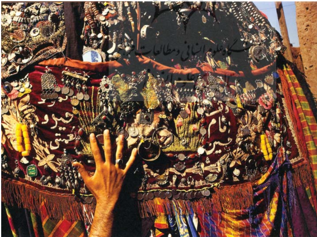
تصویر ۱۱-دخیل بستن به نخل، ایبانه