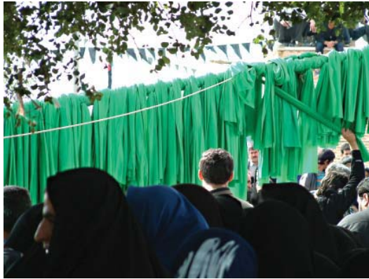
تصویر ۶- مراسم عزاداری عاشورا، ماهان، کرمان، ۱۳۸۰

عمیق از آن نباشد فقط یک تقلید صرف خواهد بود. اگر بپذیریم که جنبش های هنری، متأثر از تحولات آن جوامع بوده، پس در نتیجه باید بپذیریم که با هویت آن جوامع نیز گره خورده است. با این وصف، باید بازتاب اندیشه ها و هویت و فرهنگ آن جوامع را در ظاهر تولیدات هنری شان بررسی کرد در واقع ظاهر این آثار در آن جوامع متعلق به همان جامعه می باشد و هر جامعه دیگری