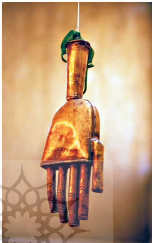
تصویر ۳۰- پنجه فلزی