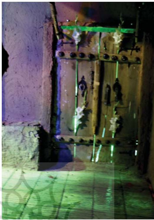
تصویر ۱۶- شبیه درب خانه حضرت زهراء (س) تهران ۱۳۸۵.

و اهل البیت (ع) موجب به وجود آمدن ویژگی های رفتاری خاص شده که در بعضی از موارد بسیار متفاوت با یکدیگر می باشد. آن چه مسلم است این بیان های مختلف اگر با شکلی از هنر هم همراه شده است، نه برای ارائه کار هنری بوده بلکه برای اظهار محبت بوده و از هنردر این اظهار ارادت بهره جسته اند. شیوه های بیانی متفاوت در مورد موضوعات خاص، زمانی داری مفهوم متعالی خود می شود که بیننده با اصل موضوع آشنا بوده و اگر درک صحیح و کاملی از موضوع اصلی وجود نداشته باشد نسبت به روایت یک بیان مذهبی ممکن است مخاطبین نا آشنا برداشت های متفاوتی نسبت به آن نمایند که آن برداشت ها، متناسب با فرهنگی قومی مذهبی هر فرد بوده و ممکن است که موجب اشتباه در درک مفهوم نیز شود. به همین دلیل در بسیاری از موارد بیان و صورت ظاهر این آداب و رسوم مذهبی مکان و شرایط خاص خود را می طلبد. صورت ظاهری بسیاری از این آداب مذهبی در مناطق مختلف به گونه ای در فضای عمومی و در مواردی در اماکن خاص اتفاق می افتاده که گونه ای از هنر محیطی به مفهوم امروزی آن بوده است. برای مثال یکی از شایع ترین هنرهای