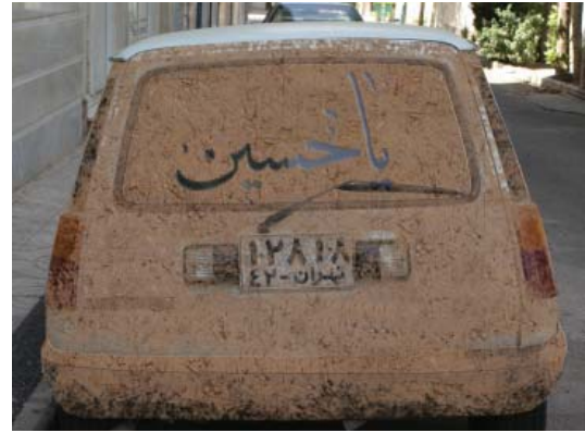
تصویر ۴- ماشین گل آلوده با ذکر یا حسین در ایام عاشورا، تهران ۱۳۸۶

عمیق از آن نباشد فقط یک تقلید صرف خواهد بود. اگر بپذیریم که جنبش های هنری، متأثر از تحولات آن جوامع بوده، پس در نتیجه باید بپذیریم که با هویت آن جوامع نیز گره خورده است. با این وصف، باید بازتاب اندیشه ها و هویت و فرهنگ آن جوامع را در ظاهر تولیدات هنری شان بررسی کرد در واقع ظاهر این آثار در آن جوامع متعلق به همان جامعه می باشد و هر جامعه دیگری