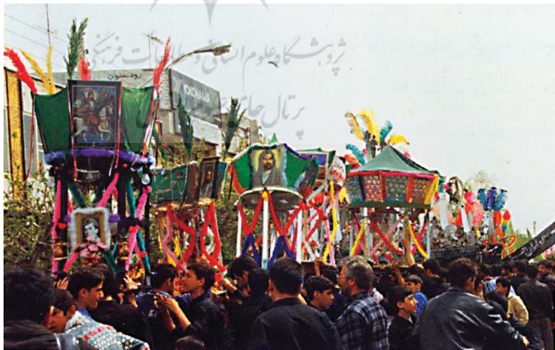
تصویر ۱۰- مراسم شمایل گردانی، تهران

توجه به موضوع و مفهوم در هنرهای جدید نیز یک پایه و اصل به شمار می رود، اما جنس این مفاهیم و موضوعات، یکی نیستند. یعنی آن هنرهای مردمی موضوعاتشان ریشه در سنن و آداب داشته و برگرفته و عقاید مذهبی بوده است و به شکل مستقیم متأثر از مسائل و موضوعات روز و حادث جامعه نمی باشند، در حالی که هنرهای محیطی رایج شده توجه خاص به مسائل روز داشته و همگامی با زمان را دنبال می کند. در مقدمه ترجمه کتاب جهانی شدن و هنر جدید اثر ادوارد لوسی اسمیت آمده است که «هنر معاصر به دلیل همین خصلت موضوع گرایی خود، در واقع واکنشی است علیه بی تفاوتی های ذاتی و جوهره بی تعهد هنر مدرن، که شکل نهایی