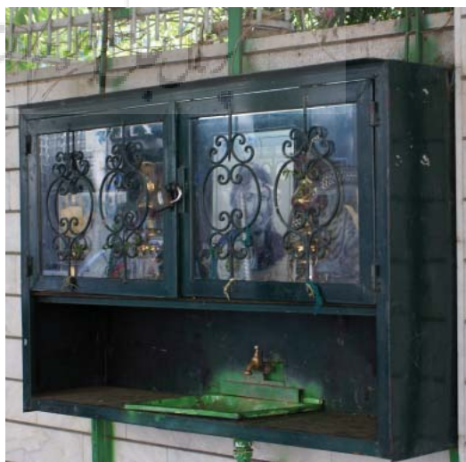
تصویر ۱۸- ساخت سقاخانه تهران ۱۳۸۵

می باشد که اصل موضوع آن ثابت بوده اما در هر نقطه ای از کشور و یا حتی در کشورهای مختلف، صورت ظاهری متفاوتی داشته است. اینکه چرا در برخورد با یک موضوع مشترک در یک کشور، روش های مختلف بیانی وجود دارد، ممکن است ریشه های مختلفی داشته باشد. اما به هر دلیل، این تفاوت در اظهار محبت به سید الشهداء (ع)