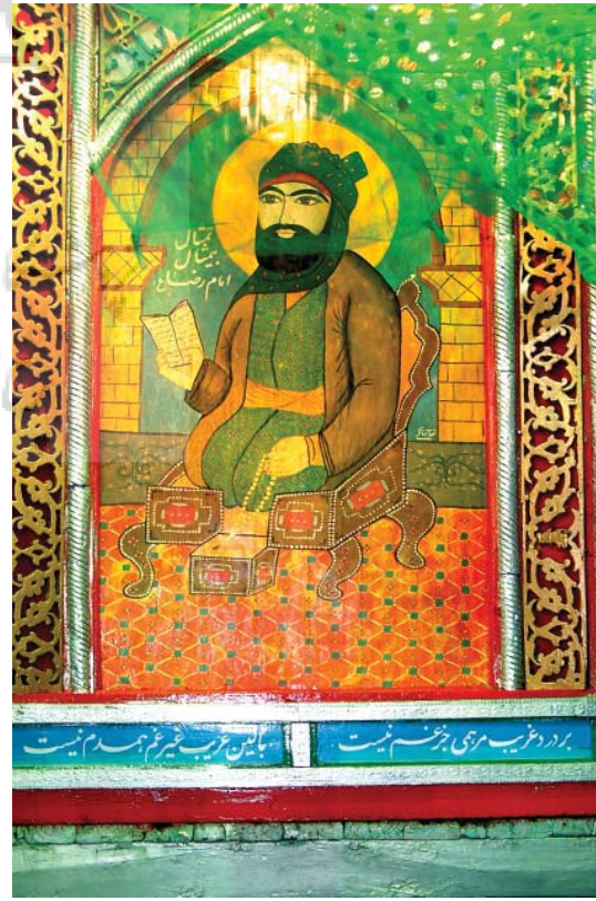
تصویر ۵- تصاویر و تزیینات روی شیدانه، دزفول، ۱۳۸۳