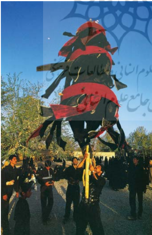
تصویر ۷- مراسم عزاداری و حمل پرچم

گونه ای عمل کنیم، تا استقلال و هویت مانیز حفظ شود. شاید بتوان نگاه ظاهری به هنر غرب را به داستان مولوی در مورد فیلی که در تاریکی قرار گرفته بود، تشبیه نمود زیرا اگر فیلی در تاریکی قرار بگیرد، هرکس در ارتباط با جزء آن می تواند نظر بدهد در واقع عدم نگاه جامع در هر رویداد هنری و فقط اکتفا نمودن به ظاهر آن، موجب عدم فهم درست از آن خواهد شد، و تا درک درست و