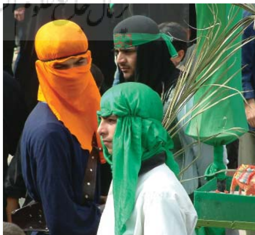
تصویر ۲۲- عزادار روز عاشورا دزفول