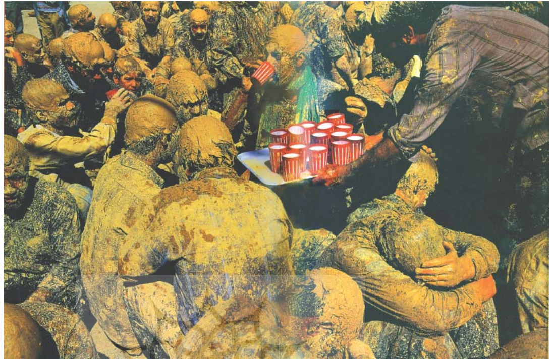
تصویر ۲۴- مراسم عزاداری عاشورا، بیجار، کردستان ۱۳۷۱