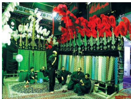
تصویر ۱۴ - تزیین داخل تکایا ، تهران ، ۱۳۸۵

توجه به موضوع یکی از شاخصه های هنر جدید بوده است اما علیرغم نظر آقای لوسی اسمیت در ارتباط مفاهیم و موضوعات هنر جدید نظر دیگری داشته است و می شود گفت که فقط بخشی