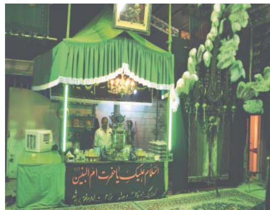
تصویر ۱۵- تزئین داخل تکایا، تهران، ۱۳۸۵

این نکته شاید باعث تداعی این ذهنیت شده است که غربی‌ها و جوامع غربی پیشرو در خلق حرکت‌های نوین به‌ویژه هنر محیطی بوده‌اند. اما همان‌طور که اشاره شد غربی‌ها و به‌ویژه اروپائیان در برخورد و استفاده از هنر شرق در اواخر قرن ۱۹ و اوائل قرن بیستم با ابتکارهای خاصی موجب تحوّل در عرصه هنر آن دوره شدند و به نظر می‌رسد که در عرصه هنر جدید و هنر محیطی نیز