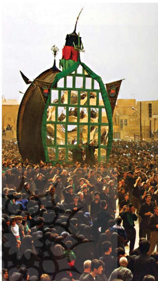
تصویر ۸- مراسم نخل گردانی عاشورا، یزد

هنر محیطی که یکی از شاخه های هنر نو محسوب می شود، به ظاهر از جوامع غربی وارد عرصه هنر ایران شده و تاکنون علاقمندان زیادی را به خود جلب نموده و درسیاست گذاری های هنر معاصر نیز به آن توجه شده است. بخشی از این هنر جدید به نظر می آید که به واقع در جوامع و کشورهای صاحب پیشینه تاریخی از دیر باز وجود داشته و اکنون نیز به حیات خود