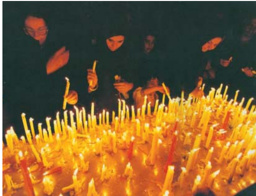
تصویر ۲۰ - شام غریبان، تهران، ۱۳۸۵

نمایشی محیطی، تعزیه خوانی است که درهرمنطقه به سبک و سیاق خودش اجراء می شد اما آن چه که موجب خاص شدن این نوع از نمایش مذهبی می شود و آن را در زمره هنرهای محیطی قرار می دهد قرار گرفتن مخاطب به عنوان جزئی از اثر است . یعنی خود مخاطب بخشی از برنامه می باشد و بدون مردم عزادار که آن ها نیز به عنوان یک عمل مذهبی در این محیط حضور پیدا می نمایند ، شکل واقعی پیدا نمی کند. زیرا مردم در این مراسم هنرمذهبی هنری تماشایی نمی باشند بلکه جزئی از اجرای آن به شمار می روند و مفهوم واقعی این دسته از مراسم وقتی که مردم به قول هنرمندان نقش ایفا می کنند ، قابل درک می شود (تصاویر ۱-۳).