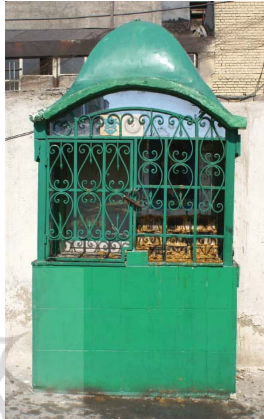
تصویر ۱۹- ساخت سقاخانه ، تهران، ۱۳۸۵

آنچه که درایران یا درکشورهای دیگر ارتباط با واقعه عاشورا و عزاداری سیدالشهداء (ع) به آن توجه شده و هنوز نیز انجام می یابد و درمواردی هنوزبه شیوه های سنتی آن انجام می شود. استفاده از امکانات روز تکنولوژی معاصر و بهره بردن از هر توانی برای بیان بهتر موضوع می باشد و به شکلی ایده های جدید تری را شاید متناسب با شرایط هنری روز جامعه به کار می برند . اما بدیهی است که هر شکل تازه ای برای بهتر برگزار شدن این مراسم بوده است ، برای مثال اگر عزاداری با حضور انبوه وسایل نقلیه مواجه می شود وبه فکرش می رسد که به گونه ای از این ها به عنوان عناصر بصری که می تواند دراین مراسم نقش ایفا کنند ، بهره برد ، نتیجه آن می شود که ما درسال های اخیر با یک شکل جدید و تزئینی خاص مذهبی شاهد حضور خودروهای شخصی درایام محرم در جامعه می باشیم .