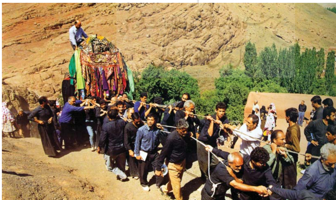
تصویر ۹- مراسم نخل گردانی عاشورا، یزد