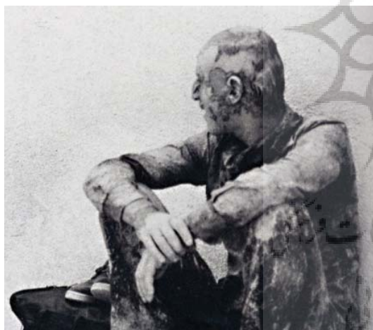
تصویر ۲۳- عزادار حسینی که خود را به گل آلوده است