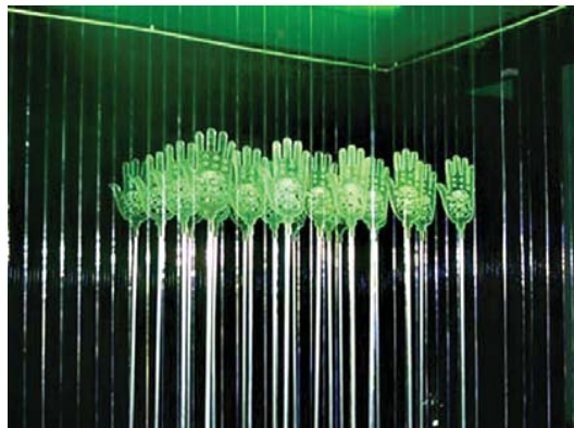
تصویر ۲۸- نمایشگاه عاشورا، موسسه صبا، تهران، ۱۳۸۵