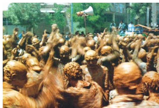
تصویر ۲۵- مراسم عزاداری عاشورا

به هر صورت استفاده از همه امکانات و تکنولوژی روز چیزی نمی باشند که به سادگی از کنار آن بگذرند و در نتیجه توانایی های صوتی و تصویری یکی از بازوهای اصلی این قبیل مراسم بوده است. در مجموع می توان مجموعه عملکردهای مربوط به واقعه عاشورا که جنبه بصری آن قابل ملاحظه می باشد را در یک دسته بندی پیشنهادی زیر قرار دارد: