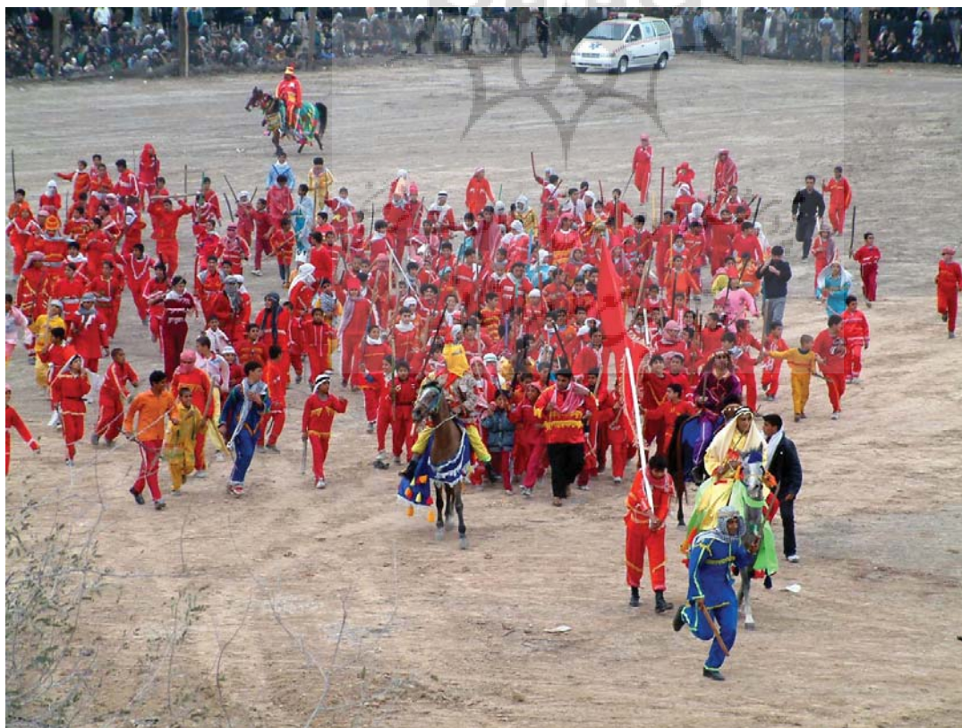
تصویر ۳- مراسم تعزیه تاسوعا، شوشتر، ۱۳۸۳

ریشه یابی عواملی که سبب به وجود آمدن این جنبش ها و تأثیرپذیری ها در آن جوامع شده بود، نکته ای است که نباید از آن غافل ماند، زیرا بسیاری از حرکت ها و تحولات هنری آن جوامع، ریشه و پیوند عمیقی با رویدادهای