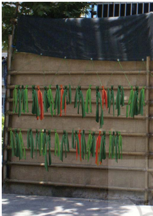
تصویر ۱۷- تزیین با کاه گل و پارچه ، تهران، ۱۳۸۵