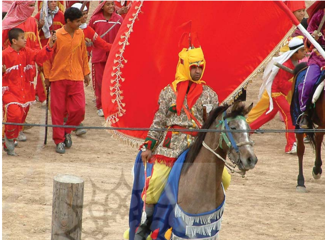
تصویر ۱- شبیه اولیا و اشقیاء در مراسم عزاداری ایام محرم، شوشتر، دزفول، ۱۳۸۳

بیشتر برگرفته از رشد و تحولات صنعتی، اجتماعی و اقتصادی در آن جوامع توسعه یافته بود، تأثیر به سزائی در کشورهای درحال توسعه و کشورهای جهان سوم که به شکلی مبهوت این تحولات بودند، گذاشته است.