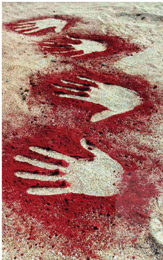
تصویر ۳۱- تصاویر دست به صورت منفی بر روی شن و استفاده از شن های رنگی