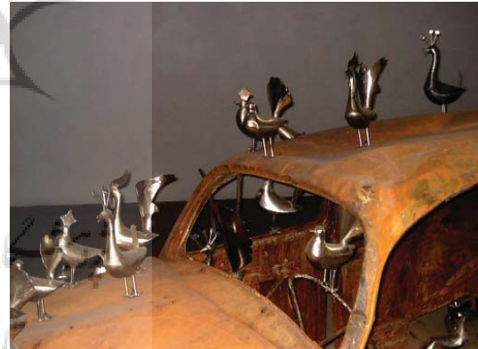
تصویر ۲۶- نمایشگاه عاشورا، موسسه صبا، تهران، ۱۳۸۵