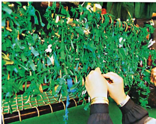
تصویر ۱۳ - توسل جویی ، مشهد مقدس