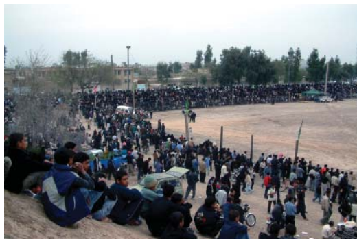
تصویر ۲- مراسم تعزیه تاسوعا، شوشتر، ۱۳۸۳

شاید عدم آگاهی و دانش لازم و زیر بنائی در مورد هنر نو، مزید بر علت بوده و به عبارت دیگر مشکل در آموزه های خود ماست که به درستی نیاموختیم که چگونه در مقابل هر پدیده هنری به