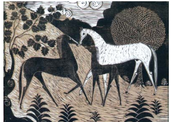
تصویر ۶- سه اسب، اثر استاد محمود جوادی پور، چاپ لیتوئوم دورنگ، سال ۱۳۳۷، اندازه ۴۸×۳۸CM