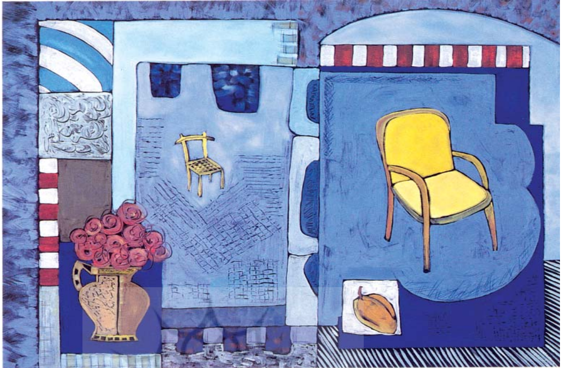
تصویر ۵- چهاردیواری، ک.سی.جویسی، شیوه تک‌چاپ، اندازه ۵۶×۷۶CM

روشن کار به تاریکی، از خطوط خشن و با جسارت به خطوط نازک و لطیف و از فضا‌های مثبت و منفی شکل یافته‌اند.