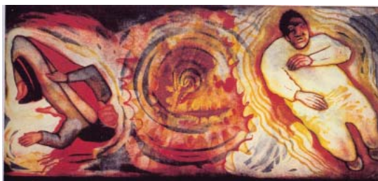
تصویر ۴- تاریخ واقعی، سیدنی. آ. کروس، اندازه ۳۳×۳۷cm، تکنیک صفحه فلزی و اسید، چاپ سنگی با لایه ضعیف، فتوسیلک اسکرین ۱

ترفندهای خلاقانه‌ای برای همیشه از میان برداشته شد. یکنواختی بدور از خلاقیت و سنت در هنر به خصوص در روند چاپ گود، کاربرد و نحوه بیان احساسات هنری هنرمند را متوقف کرد و همین امر موجب شد تا مورد اعتراض هنرمندان قرار گیرد. خوشبختانه، آفرینندگان هنر پیوسته در جستجوی یافتن فرم‌های جدیدی برای ابراز و بیان احساسات خود هستند وعده‌ای از آنان به طور اجتناب‌ناپذیری برای بیان عقیده و دیدگاه خویش به چاپ حکاکی توسل جسته‌اند» (Liebman, 1992, 7)