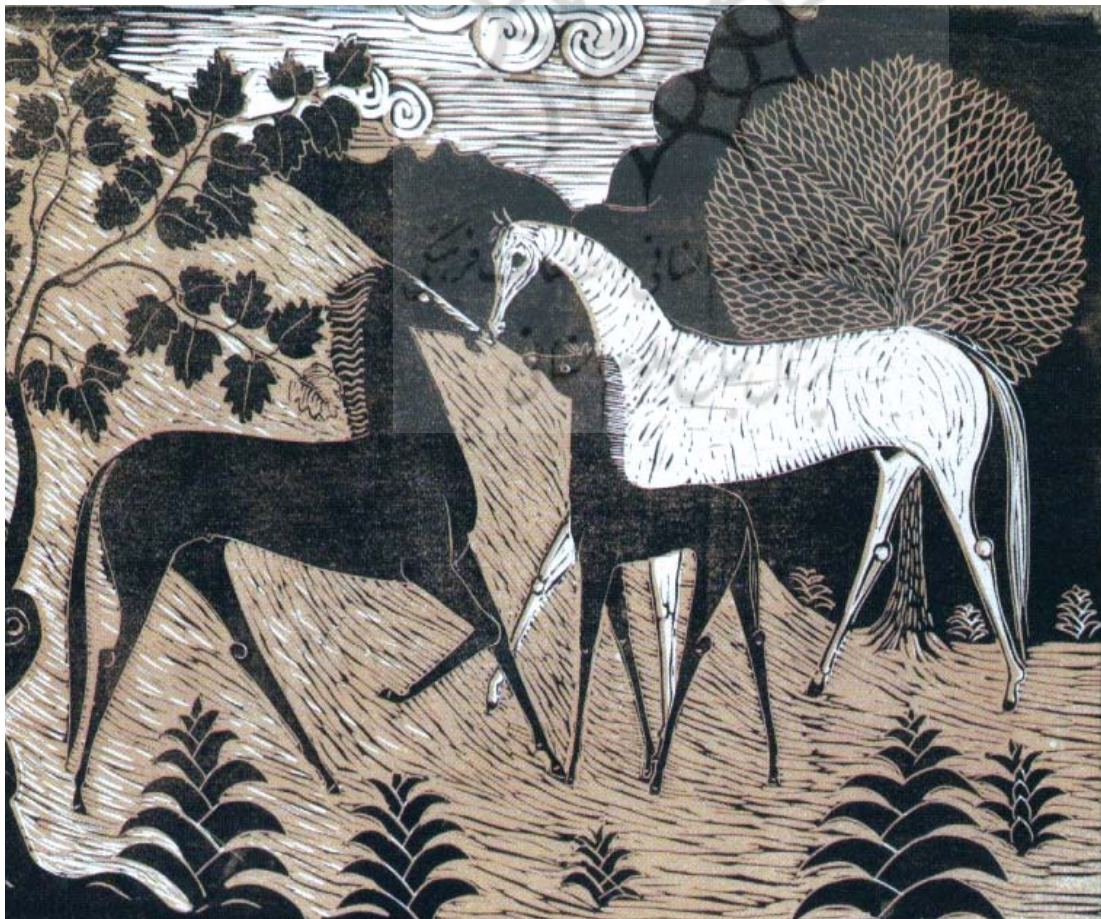
سه اسب، اثر استاد محمود جوادی پور، چاپ لیتوگرم دورنگ، سال ۱۳۳۷، اندازه ۳۸×۴۸cm