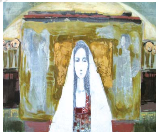
تصویر ۱۷- کار دانشجویی

تصویر ۱۲- در این تصویر مستقیماً چاپ حکاکی به عنوان یک اثر هنری ارائه شده است.