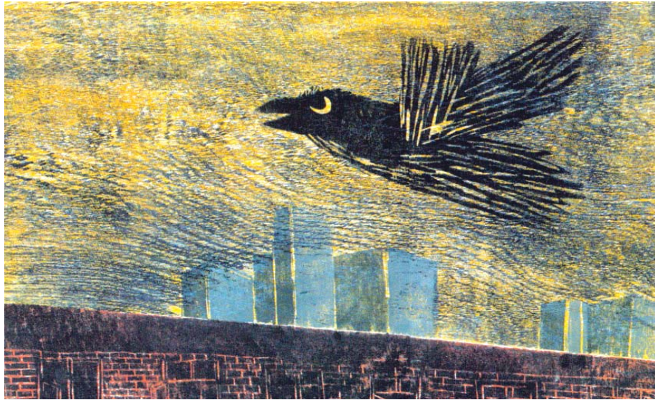
تصویر ۱۶- خبر داغ کلاغ، اثر پروین هانی طبایی، شیوه چاپ: حکاکی و چاپ چوب

تصویر ۱۳- در این اثر تلفیقی از نقاشی آبرنگ و چاپ حکاکی که به صورت مهر برای تکرار شکلهای خانه به کارگرفته شده است و به عنوان لایه‌های هماهنگ‌کننده رنگ های تصویر استفاده شده است.