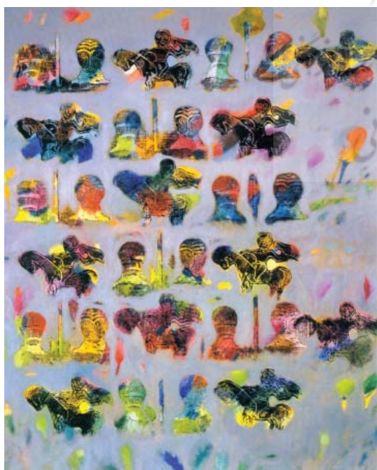
تصویر ۱۱- بدون عنوان، اثر حبیب توحیدی، شیوه چاپ: آکرلیک

تاثیر و کاربرد چاپ حکاکی در هنر نقاشی معاصر ایران را میتوانیم در نمایشگاه‌های بین المللی و دوسالانه‌های ارتباط تصویری،