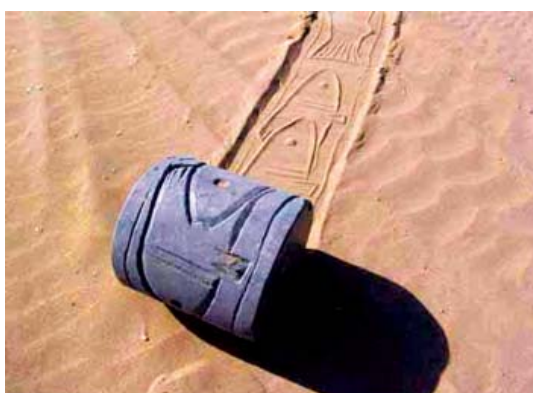
تصویر ۸- نقش مهرچاپ روی شن با مهر غلطان

محسوب کرد. وی درباره کار خود می‌گوید: «شیوه تک‌چاپی که من بکار می‌برم قبل از اینکه اثر کامل شود چندین بار در دستگاه پرس حکاکی قرار می‌دهم و سپس با کار کردن مستقیم روی کار چاپ شده، برای تاکید و یا مشخص کردن برخی از وجوه تصویری قبل از اینکه کارم تمام شود تغییراتی می‌دهم و هرگاه یک اثر تک‌چاپ می‌سازم می‌کوشم تا به درخشش و شفافیت یک اثر آبرنگ دست یابم.» (green, 1990, 43) (تصویر ۲)