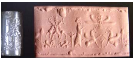
تصویر ۱۰- نمونه ای از مهر استوانه ای و اثر آن بر گِل

یکدیگر ساخته شده و گاه این تکنیک ها با نقاشی هم ترکیب می‌شوند که نمونه‌ای از این آثار به عنوان ترکیب مواد یا مواد مختلط در ایران معرفی شده‌اند.