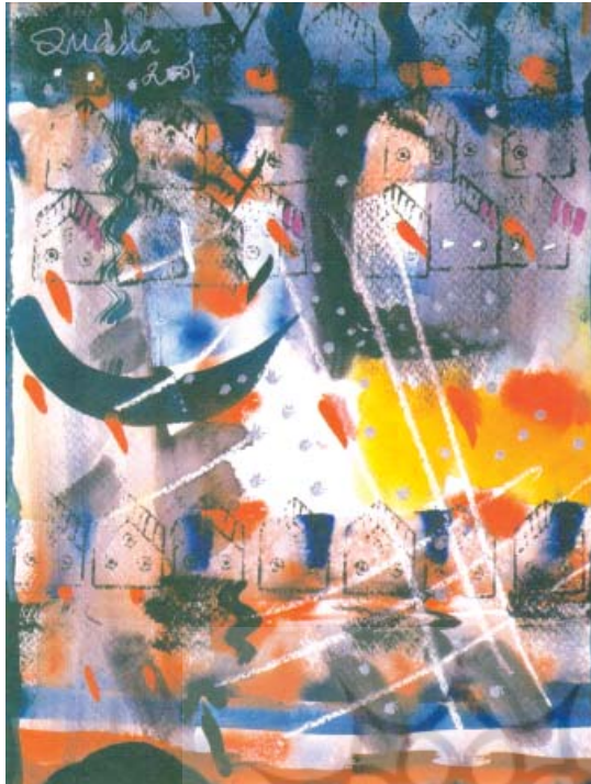
تصویر ۱۳ - بدون عنوان، قدیسا نیسار (هنرمند پاکستانی)، شیوه چاپ: چاپ روی آبرنگ