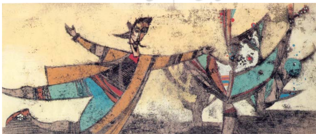
تصویر ۱۵-- آقای زیزیلو می‌تواند پرواز کند؟، اثر مانی منوچهری، شیوه چاپ : تکچاپ و گواش

«مهرهای مزبور عبارت بودند از استوانه‌های کوچک که در وسط آن‌ها سوراخ بوده و بر روی آن‌ها نقش متعلق به پادشاه و اسم رسم و عنوان او در بالا یا پائین حک شده بوده است و این مهر را مانند غلظک بر روی موم مذاب می‌غلطانند و سر