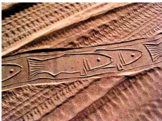
تصویر ۹- نقش مهر روی شن با مهر غلطان

گروهی از این هنرمندان که به «چاپ‌نقش‌سازان» (Printmaking) مشهورند آثاری را بوجود آورده اند که از تلفیق تکنیک‌های چاپ حکاکی با