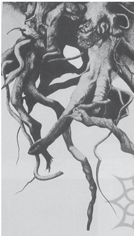
تصویر ۱- ریشه ها، ۱۹۸۴، چاپ قلم سوزنی، چاپ سیام اندازه ۲۵×۴۵ سانتی متر

۲- تک چاپ : شیوه ای که در آن نقشی را بر سطح شیشه یا هر سطح صیقلی نظیر آن نقاشی می کنند و قبل از خشک شدن رنگها با قرار دادن ورقه کاغذ بر روی شیشه تک نسخه ای چاپی از آن نقاشی می گیرند.