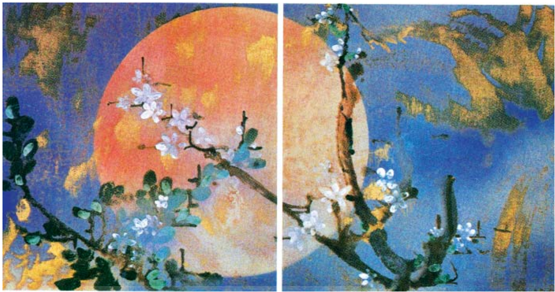
تصویر ۲- عصر توین راکر، ۱۹۸۱، تک‌چاپ دولته‌ای ۱۴×۱۱ CM، ۶۰

که این روند، فردیت را در هنر مدرن مطرح می‌کند. به همین لحاظ هنرمند معاصر در پی آن است که از چه نوع ابزار و مصالحی برای بروز و جلوه خلاقیت خود استفاده کند و این امکان به واسطه چاپ حکاکی و انواع آن قابل وصول می‌باشد. امپرسیونیست‌ها که از سال‌های (۱۸۶۰-۱۸۶۹م) با این باسمه آشنا شدند، شیوه سازماندهی فضایی، موضوعات مأنوس و صمیمانه، و نقاط رنگ‌آمیزی شده تخت و فاقد برجسته‌کاری آن‌ها را ستوده‌اند و نکات و دستورات عمل‌های بسیاری از آن‌ها آموختند». (گاردنر، ۱۳۷۸، ۵۹۶)