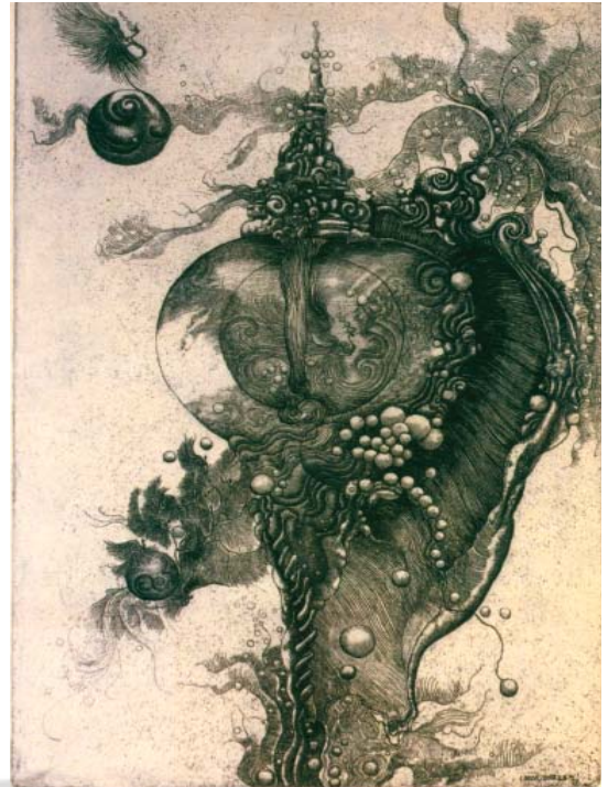
تصویر ۱۲ - بدون عنوان، ایلیس نور (هنرمند مالزی)، تکنیک: چاپ تیزابی

مانند کنده کاری روی چوب، لینولئوم، فلز، چاپ سنگی و ضمناً نقاشی روی پارچه با شیوه باتیک به نمایش گذارده می‌شد. دیدن این نوع کارها برای بینندگان تازگی داشت (تصویر ۶).