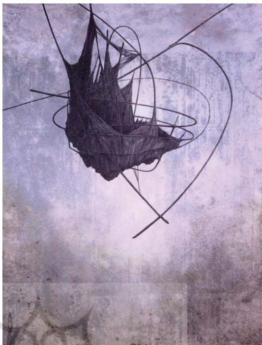
تصویر ۳- موج احساسات، مایکل دی بارتس، اندازه ۷۶×۷۶cm، شیوه لیتوگرافی (سنگ و فلز)، چاپ تیزابی سوزنی

روش کار برلین با یک طرح کلی یا گرفتن عکس‌هایی از موضوع دلخواهش شروع می‌شود و پیش طرح (اتود) از ترکیب‌بندی اصلی ترسیم می‌کند و سپس آن را روی «کاغذ گرده‌برداری» منتقل می‌کند. از روی کاغذ گرده‌برداری، با ذغال طراحی روی سطح فلز روی یا مس طرح را پیاده