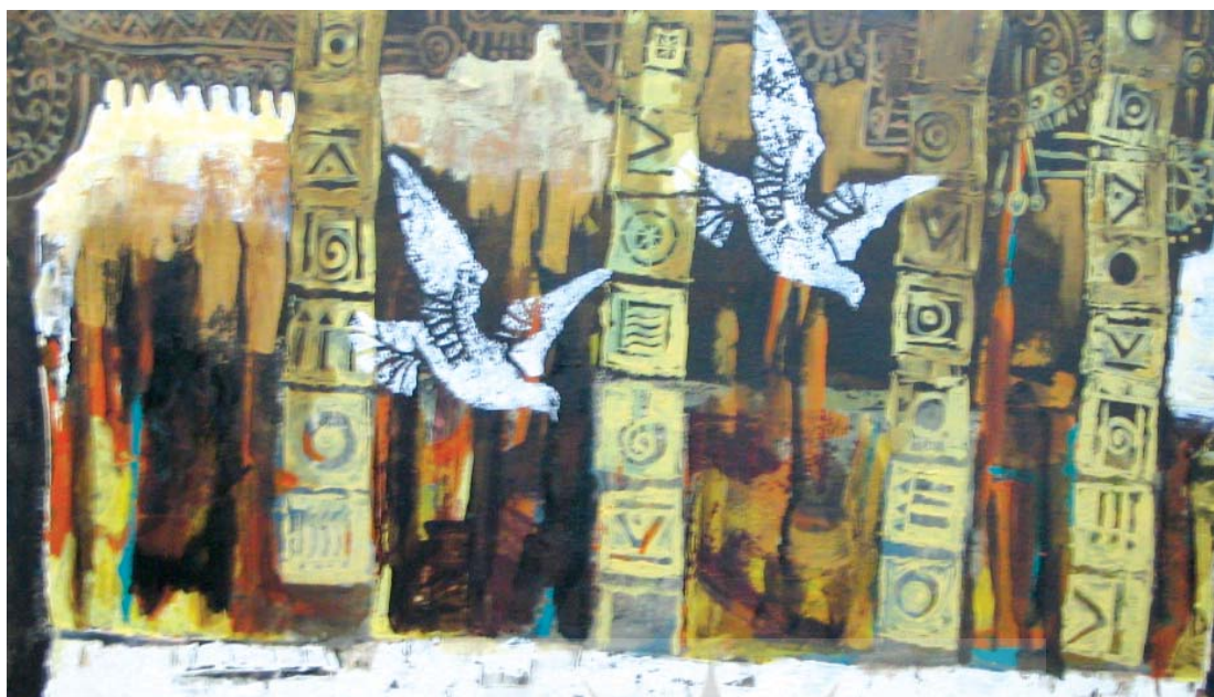
تصویر ۱۹- کار دانشجویی که کبوترها با چاپ یونولیت کار شده اند

سال تصویرگران (۱۳۸۵) از لایه های چاپ حکاکی به عنوان زمینه هنر خود استفاده کرده اند (تصاویر ۱۴-۱۵-۱۶). بعضی از دانشجویان، از یونولیت (Polystyrene) در ایجاد بافتی جدید و یا تکرار نقش بعنوان مهر در تجربه نقاشی سطح سه، جهت بیان شخصی استفاده کرده اند (تصاویر ۱۷-۱۸). تلفیق چاپ حکاکی گود و برجسته از دیگر نوآوری‌هایی است که بعضی از هنرمندان در قالب