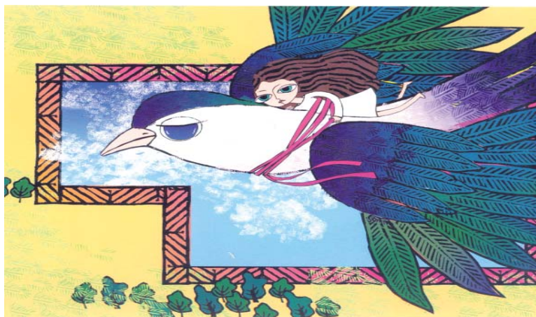
تصویر ۱۴- بندانگشتی، اثر فریده شهبازی، شیوه چاپ : تکچاپ و رایانه

فرمان‌ها را به این طریق با مومی که مهر شاه بر آن ثبت شده می‌بستند» (دانشور، ۱۳۷۰، ۱۴).