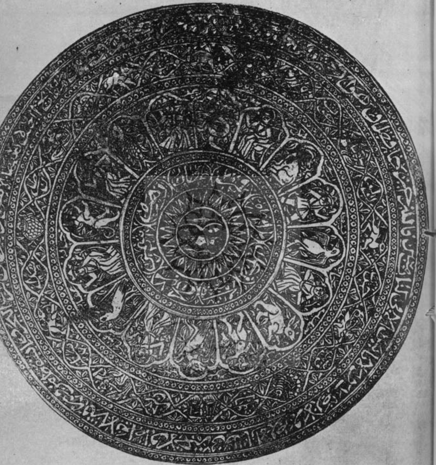
صفحة زرمل از برنج