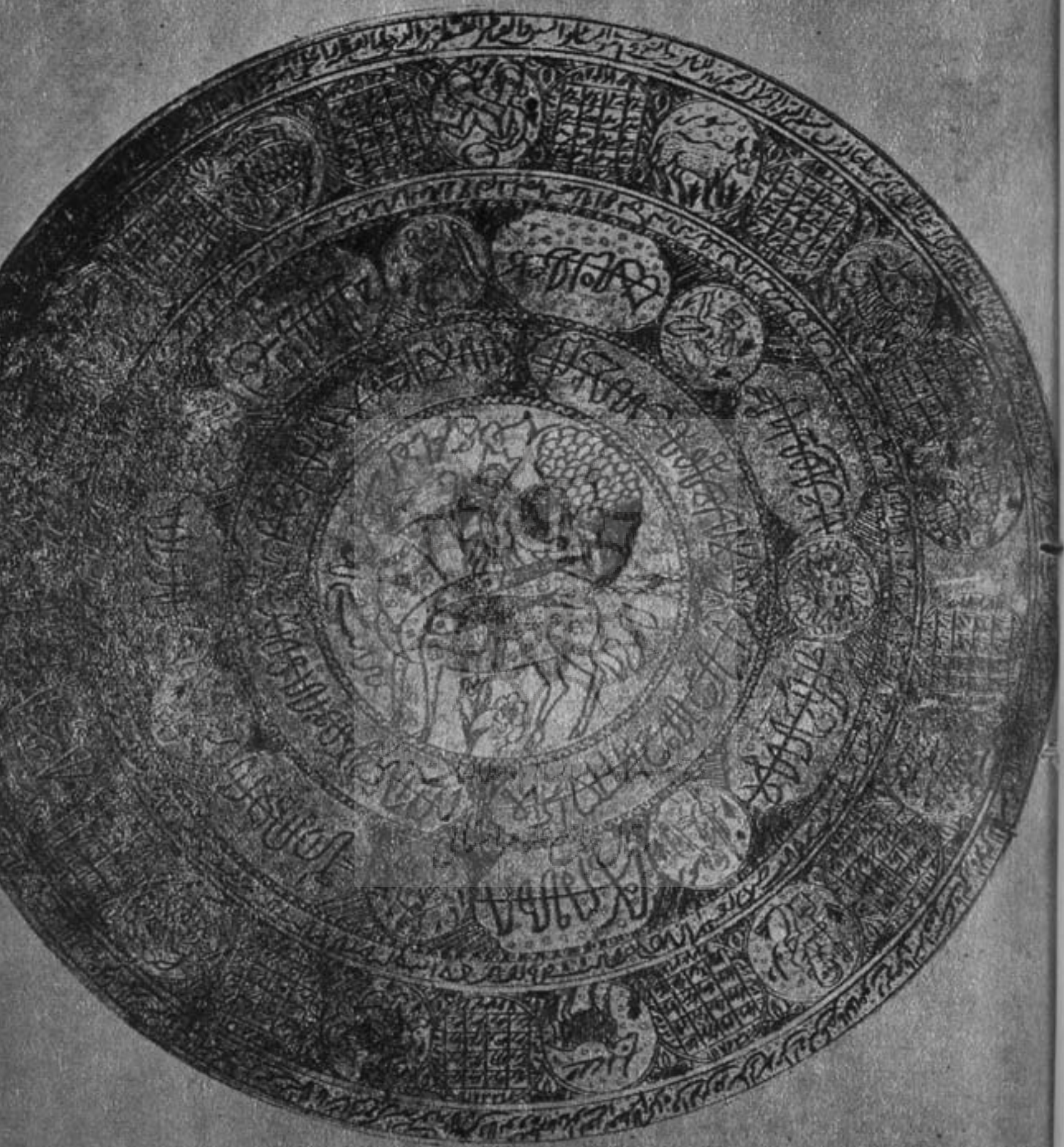
صفحة رمل از برنج