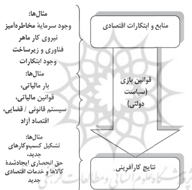
شکل شماره ۱. فرصت‌های کارآفرینانه (هال، سوبل، ۲۰۰۶).

فرایندهایی که از طریق آن نتایج کارآفرینانه‌ای تولید شده‌اند، مهم است که در شکل ۱ نشان داده شده است. این شکل به رده‌بندی کردن اطلاعات بر فرایند کارآفرینی کمک می‌کند. منابع و ذخایر کارآفرینی از قبیل سرمایه‌مخاطره‌آمیز و میزان دسترسی به این منابع به نتایج کارآفرینانه ربط داده شده است. این مدل به‌روشنی نشان می‌دهد که افزایش کارآفرینی می‌تواند هم توسط افزایش منابع نسبت به فرایندها یا توسط ارتقای قوانین برای کارآفرینان به دست آید (هال، سوبل ۱ ، ۲۰۰۶).