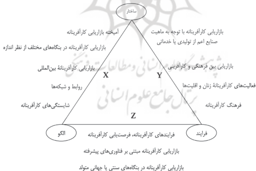
شکل ۲. نگاشت مفهومی بازاریابی کارآفرینانه

صنعتی. بنابراین، توجه به تفاوت‌های فرهنگی و ساختارهای اجتماعی، به ویژه اقلیت‌ها، از جمله زنان، در این محور منشأ اثر خواهد بود. جایگاه فرهنگ کارآفرینانه نیز اینجاست. محور Z تصویرگر ظهور پارادایم‌های تفسیرگرا و پسانوین‌گرایی است. خمیرمایه پسانوین‌گرایی رد ساختارها و شکستن آنهاست. در این محور، حرفی از ساختار به میان نمی‌آید. هر چه هست، معناست و ذهنیات و ابزارهای معناکاوی عبارتند از: «فرهنگ، زبان و فناوری و ارتباطات». پس با نوعی کثرت‌گرایی پیچیده در معنا مواجه خواهیم بود. با نفی ساختارها به بررسی غشای پدیده و تحلیل ظاهری آنها بسنده می‌شود. فرصت‌یابی کارآفرینانه و بازاریابی کارآفرینانه مبتنی بر فناوری‌های پیشرفته و نیز گستره عمل بازاریابی کارآفرینانه اعم از بنگاه سنتی یا جهانی متولد و نیز فرایندهای کارآفرینانه در این محور قرار می‌گیرد. متناسب با مطالب پیش‌گفته و با توجه به ماهیت پیش‌تاز بودن عمل‌گرایان نسبت به دانشگاهیان در قلمرو کسب‌وکار، حداکثر می‌تواند با جانمایی مناسب اقدامات و بدیل‌های اجرایی توصیف‌گر فعالیت‌های آنها باشد، زیرا ایجاد نوعی تغییرات جزئی در سیستم‌های اقتصادی و اجتماعی می‌تواند زمینه‌ساز شکل‌گیری فعالیت‌های اقتصادی به شیوه‌ای دیگر باشد و از این حیث نیازمند رخدادهای بازنگری در مصادیق الگو خواهد بود.