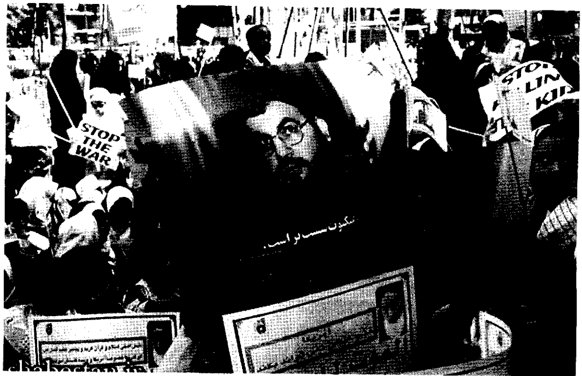
سکون سسارو است.

نمی‌دیدند ناگهان هر یک به ملتی ظاهراً مستقل و مجزا دست‌بندی و بسته‌بندی شدند. گاه خط‌کشی‌های ملی از میان یک قوم می‌گذشت و آن را در چند ملت مجزا دست‌بندی می‌کرد. ملاک این خط‌کشی‌ها و دست‌بندی‌ها چه بود؟ گفته می‌شد: «ملیت».