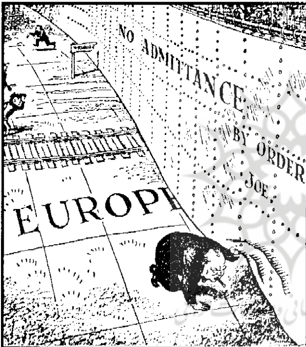
(یک کاریکاتور از یک روزنامه انگلیسی در مورد سخنرانی

ج) «محاصره‌ی برلین اروپا را به جنگ نزدیک کرد». تا چه حد با این نظر موافقت می‌کنید؟ شرح دهید.