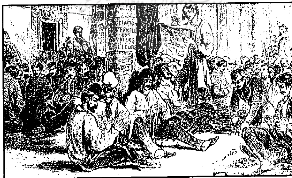
(کارگاه‌های ملی در پاریس، سال ۱۸۴۸)