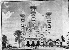
مسجد صومیه مالزی

مؤلف مهمترین تألیف در این باره را کتاب هنر اسلامی نوشته ارنست کونل می داند، که معماری اسلامی را بر اساس دوره زمانی یا منطقه خاصی تقسیم بندی نکرده است. نویسنده این فصل از کتاب خود را بر اساس نوشته کونل تنظیم کرده، و در حقیقت خلاصه همان کتاب را در این فصل آورده است، که به فراز ذیل می آید: