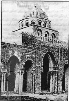
مسجد شیخی علی، ایران

برخی از فصلهای کتاب همانند فصلهای ششم و دهم، کاملاً تکراری است. فصل ششم خلاصه چند کتاب بویژه نوشته کونل است، و فصل دهم تکرار آن به گونه دیگر، در حالی که با آوردن فصل دهم، نیازی به تلخیص کتاب کونل نبود.