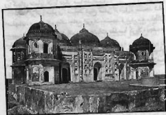
مسجد سامره در بغداد

نویسنده در این فصل، از دیگر مساجد تاریخی اسلام سخن می‌گوید. از آنها که قدس‌ترین آنها مسجد جامع عمروبن عاص به مسجد عتیق هم خوانده شده است، آنها را مساجد عتیقه می‌نامد؛ و چون عمره‌ها آنها بیش از هزار سال است، آنها را الفیه (هزارساله) نامیده است. این مساجد عبارتند از: مسجد جامع عمروبن عاص، گنبد صخره، مسجد جامع فیروان، مسجد جامع اموی دمشق، مسجد الاقصی، مسجد جامع قرویین فاس، مسجد جامع قرطبه، مسجد جامع سوسه، مسجد سامره، مسجد جامع احمدبن طولون و مسجد جامع الازهر.