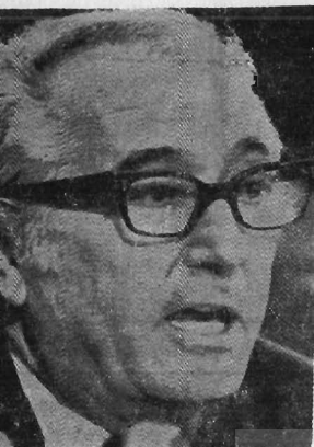
پیتسر - رودینو رئیس کمیسیون قضایی مجلس نمایندگان آمریکا که وظیفه تهیه گزارش اعلام جرم نیکسون و محاکمه او را درسنای آمریکا به عهده دارد

در آمریکا دمعرض تهدید و تزلزل دائمی قرار بگیرد.