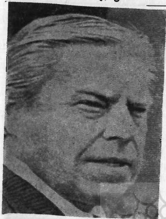
«جان رونس» رهبر جمهوریخواهان در مجلس نمایندگان آمریکا از جمله رهبران حزب جمهوریخواه است که پس از انتشار خلاصه مکالمات کاخ سفید از حزب نیکسون به صفت افتقاد کنندگان از رئیس جمهوری پیوسته او را تشویق به استعفا نمودند.

سنای آمریکا قطعی نیست و از آنجائیکه برای محکومیت رئیس جمهوری و برکناری وی اکثریت بیش از دو ثلث آراء سناتورها ضروری است این شانس برای نیکسون وجود دارد که در آخرین مرحله رأی موافق بیش از یک سوم سناتوری آمریکا را بطرفداری از خود جلب نموده از تصویب اعلام جرم مجلس نمایندگان در رأی آمریکا جلوگیری بعمل آورد، لیکن ابقای وی در مقام ریاست جمهوری پس از طی این مراحل با دشواریهای بسیاری برای آمریکا و دنیا همراه خواهد بود و نیکسون در باقیمانده دوران ریاست جمهوری خود در برابر یک کنگره مخالف رأی از پیش نخواهد برد.