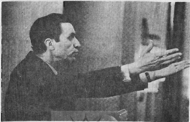
«ژان روابه» سومین نامزد قوی ریاست جمهوری فرانسه از جناح راست

قرار خواهد گرفت و این بار شانس پیروزی یکی از دو کاندیدای موفق جناح راست بیش از میتران خواهد بود، زیرا آراء متشقت و پراکنده جناح راست در دور اول انتخابات، هنگام برگزاری دومین دور انتخابات در اواخر اردیبهشت ماه یکجا بنام رقیب میتران به صندوق های اخذ آراء ریخته خواهد شد و همه فرانسویانی که در دور اول انتخابات آراء خود را بنام کاندیدا های مختلف جناح راست در صندوق ها ریخته اند این بار بخاطر جلوگیری از انتخاب میتران به کاندیدای واحد جناح راست رای خواهند داد، زیرا بسیاری از فرانسویان، بخصوص طبقه متوسط و کشاورزان فرانسوی از روی کار آمدن يك حکومت سوسیالیست - کمونیست در فرانسه نگرانند و همین بیم و نگرانی بزرگترین عامل موفقیت هر کاندیدای دست راستی در برابر نامزد ریاست جمهوری جناح چپ می باشد.