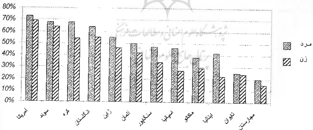
نمودار شماره ۲: مقایسه مردان و زنانی که از اینترنت استفاده می‌کنند.