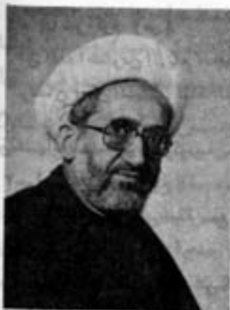
آیت الله حسین نوری