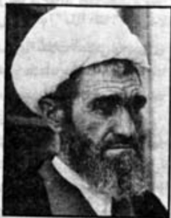
آیت الله مشکینی