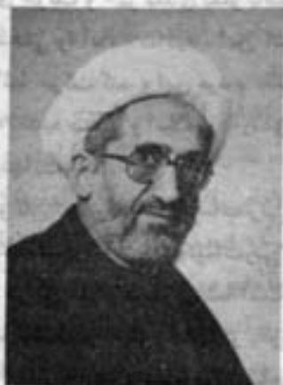
آیت الله حسین نوری