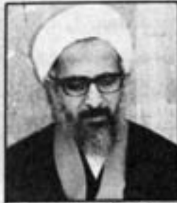
آیت الله جوادی آملی