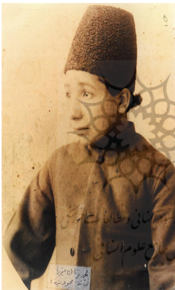
حاج محمد زمان میرزا

شاهزاده محمود میرزا ذوق و استعداد شاعری داشت و کتاب‌های متعددی از وی به جا مانده است، از قبیل!!!!!!المحمود، گلشن محمود، جهان محمود. دیوان محمود میرزا شامل مجموعه‌ای از سروده‌های شعرای زمان قاجاریه است. وی خدمات ارزنده‌ای به اهالی نهاوند و لرستان نموده که با مراجعه به تواریخ، صدق گفتار بنده روشن خواهد شد.