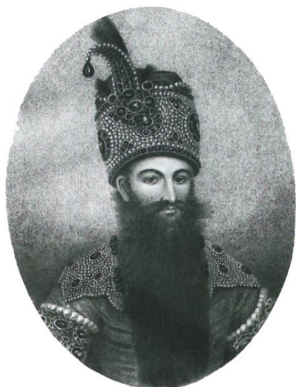
فتحعلی شاه قاجار

۴) فرزند چهاردهم ایشان محمود میرزا قاجار است که در عنفوان جوانی به حکومت نهاوند منصوب شد و خدمات وی در نهاوند روشن و عیان است، از جمله: