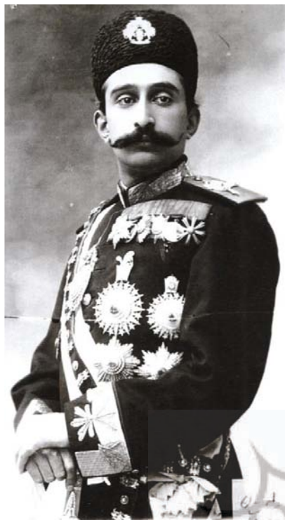
سالارالدوله حکومت نهایوند و لرستان