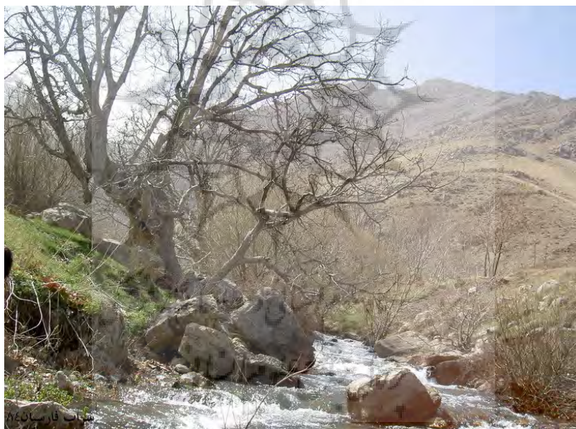
تصویر (۳): یکی از سرشاخه‌های رودخانه گاماسیاب

در حواشی این سراب درختان کهن‌سالی با بیش از ۵۰۰ سال عمر (یادگاری از