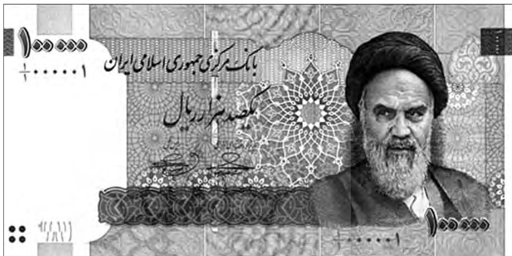
یکی از رویدادهای سال ۱۳۸۹، انتشار اسکناس یکصد هزار ریالی است.

بانک‌هایی که در این گزارش مورد بررسی قرار گرفته‌اند، عمدتاً در کشورهای اروپایی قرار دارند و کاهش سپرده‌های