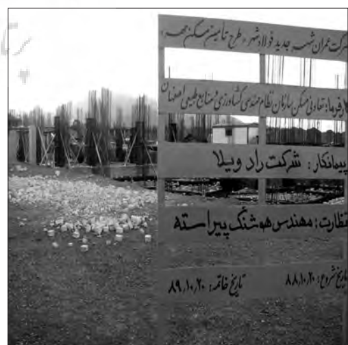
حمایت از طرح تأمین مسکن مهر، یکی از اولویتهای ما است.

وی سپس از تضمین وزارت اقتصاد و بانک مرکزی برای سرمایه گذاری تمام سرمایه گذاران در کشور خبر داد و گفت: با ساماندهی بازار پول در دو سال گذشته، بورس و بانکهای کشور جان تازه ای گرفته اند، زیرا این عمل باعث حذف بازارهای غیرمتشکل پولی که تحت عناوین قرض الحسنه و مؤسسات اعتباری بدون مجوز در کشور فعالیت می کردند، شده است.