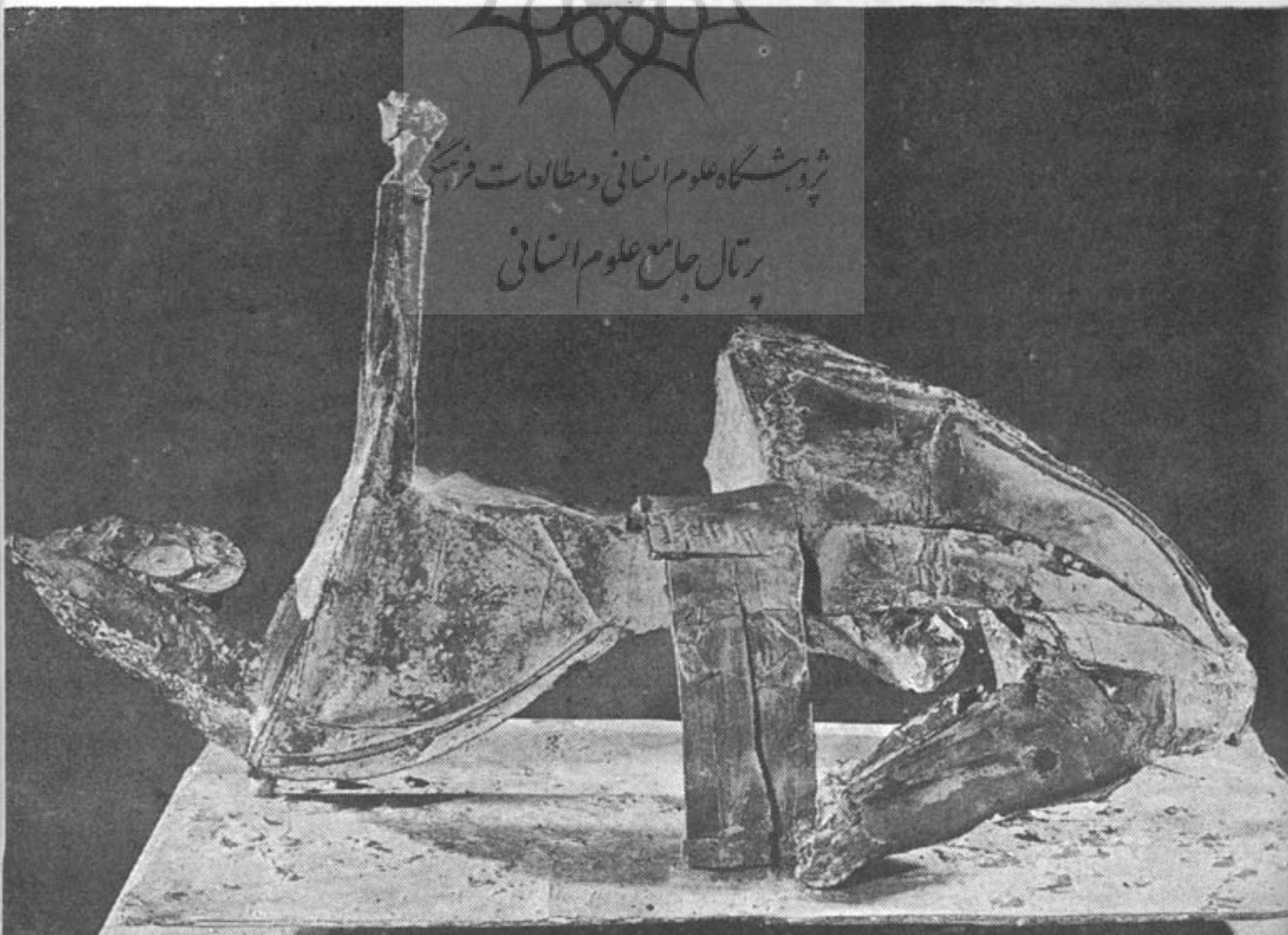
(مارینو مارینی : فریاد)

پروژه نگاه علم و مطالعات فرهنگی پرتال جامع علوم انسانی