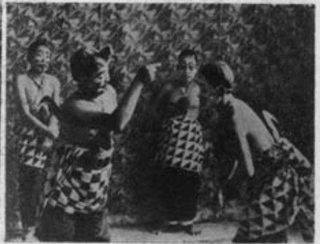
یک صحنه از نمایش محلی اندونزی

وراههای جدید هنری روز بروز با توجه و کمک دولت در کشور اندونزی توسعه مییابد مدارس مخصوص تئاتر و رقص برای ضبط آثار گذشته و نمایش آنها کوشش میکنند. ما امیدواریم در شماره های بعدی - هائی از نمایشنامه های این کشور را برای استفاده خوانندگان در مجله نمایش درج نمایم.