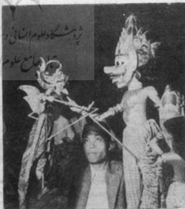
استاد خیمه شب بازی در حال نمایش

ملودیهایی هنری در موسیقی اندونزی پایه و اساس را تشکیل داده است منتهای مراتب در دست ارکستر ملی اندونزی که به > گاملانک > موسوم است، سنج ها و طبل های بزرگ و کوچک آنچنان زیاد است که تم اصلی را تشکیل میدهد و شنیدن آن برای گوشهای عاری بسیار مشکل است. از تشریح سازهای مختلف و از نوع ملهها چون از