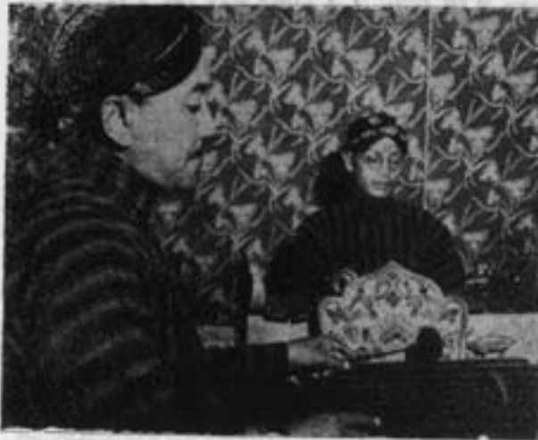
نوازندگان سازهای ملی اندونزی