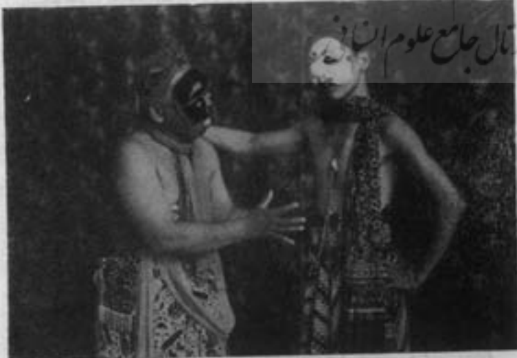
امایش با ماسک