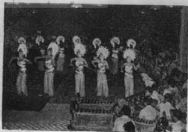
صحنه‌ای از رقص دسته جمعی بالیهای ملی و محلی

همانطور که قبلا اشاره کردیم در این نمایشات دو وجههٔ باور دیده میشود، اولاً موسیقی محلی که در تمام مدت اجرای