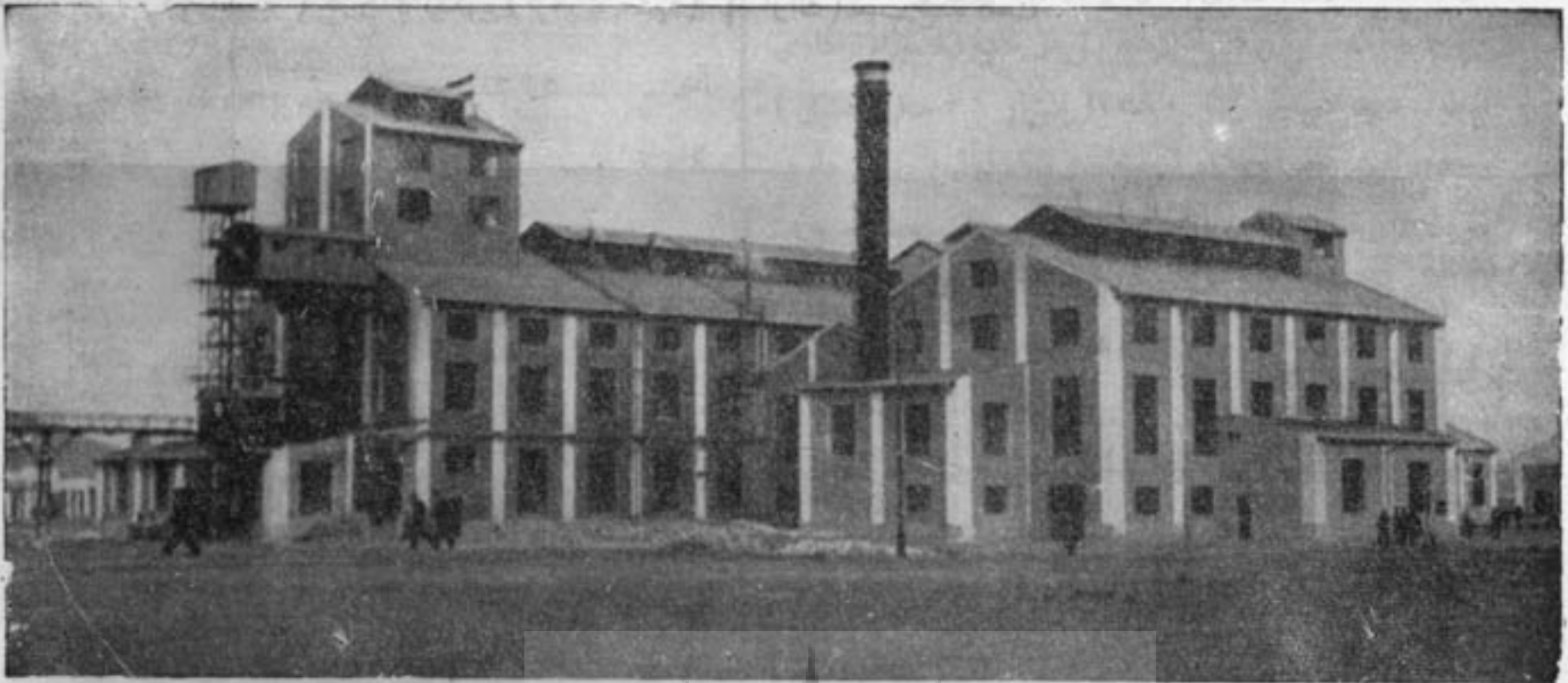
قسمتی از ساختمان کارخانه قند سازند اراک

کارخانهای داخلی بپایه محصول سالهای پیش برسد این مقدار قند تقریباً ربع مصرف کل کشور را در حال عادی و نلث احتیاجات مردم را با وضع جیره بندی فعلی تأمین میکند. ولی با تکمیل تصفیه خانه و راهمین و توسعه زراعت چغندرکاری محصول کارخانهای کنونی ممکن است تا نصف و حتی دو نلث احتیاجات کشور را مرتفع نماید (قند مصرفی هر نفری در سال تقریباً ۶ کیلو میباشد) سهم هر نفری از محصول سال ۱۳۱۹ کارخانهای قند کشور ۲۳۴۰ گرم بوده (جمعیت کشور ۱۵ میلیون حساب شده)