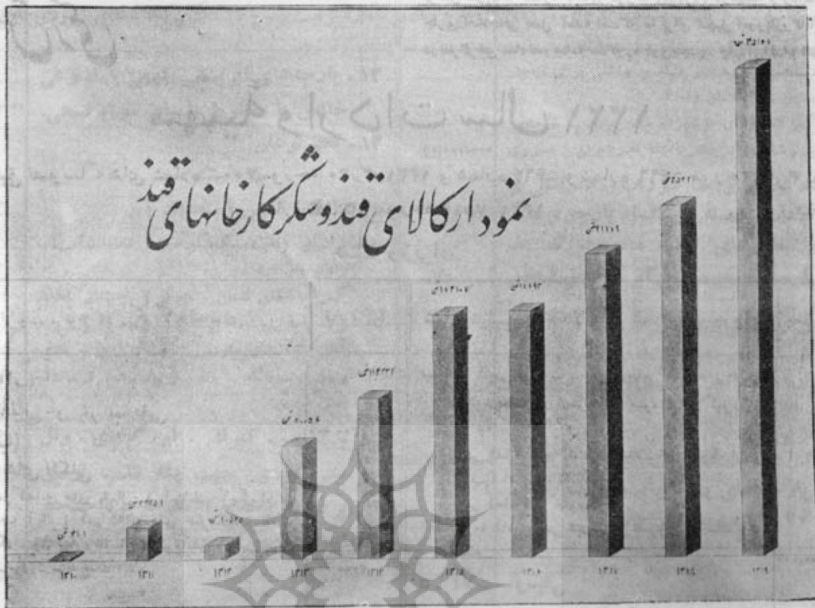
نمودار ده ساله محصول کارخانهای قند سازی ایران ۱۳۱۰ - ۱۳۱۹

مقداری از مواد شیمیائی مورد مصرف از داخل کشور بدست میاید و قسمتی هم از خارج وارد میشود.