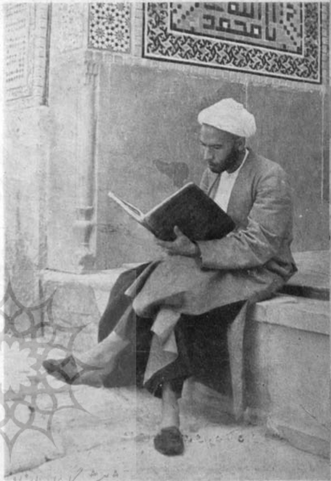
یکی از طلاب کاشان

بعد از کاشان بزرگترین شهر آن راوند نام دارد که محل بزرگترین کارگاههای قالی بافی است. مسجد جامع که از شاهکارهای معماری است در شهر راوند است. آران، بهدکل، بزرگ ازیهلاقات و قشلاقات کاشان است که محصول عمده و معروف آنها سیب گلایی و مخصوصاً انار می باشد. نیاسر و قصر دوشهر دیگر کاشان است که عطر و کلاب آنها در ایران معروف است و آبشار بزرگ نیاسر در ایسران بی نظیر است زمین جوشقان خالدآباد نطنز، بوزیدآباد، مهر رود و نوش آباد، از شهرها و قصبهات دیگر کاشان است که محصول آنها عطر، و قالی و میوه است.