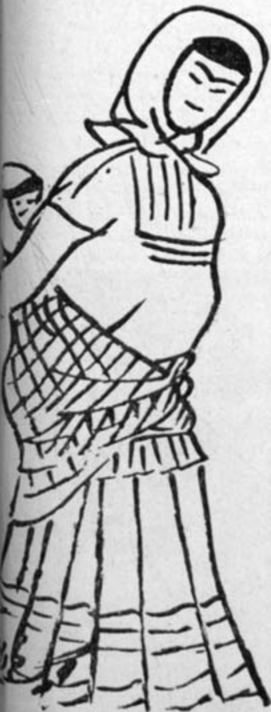
در این دیار زانی بردبار و صبور ندی میکنند

چه دانند که دلبرد در کجایی از مذاهب مختلفه در این بلاد بجز سید دراند خانوار بودی کسی نیست و از ایشیه و عمارات در آن بسیار است که بغایت مشهور است و از آن گونه: بقعه بابا افضل، مسجد جامع مدرسه سلطانی، میر نشانه، قدمگاه حضرت علی بن ابیطالب، قدمگاه صالح آباد، امامزاده هلال، مزار ملامحسن فیض، امامزاده سطا بخش، مزار ابولولو، مزار محتشم و غیره اما چگونگی کویم که این بلاد چه مصیبت‌ها که از جنگ و ملوک الطوائفی که ندید و پیوسته در کبر و دار حوادث بوده چندی ملوک الطوائفی بود پس آنکاه شاه سلطان حسین صفوی بخاطر اینکه مردم این شهر تمکون و اطاعت او را نمیکردند حکم بقتل و غارت