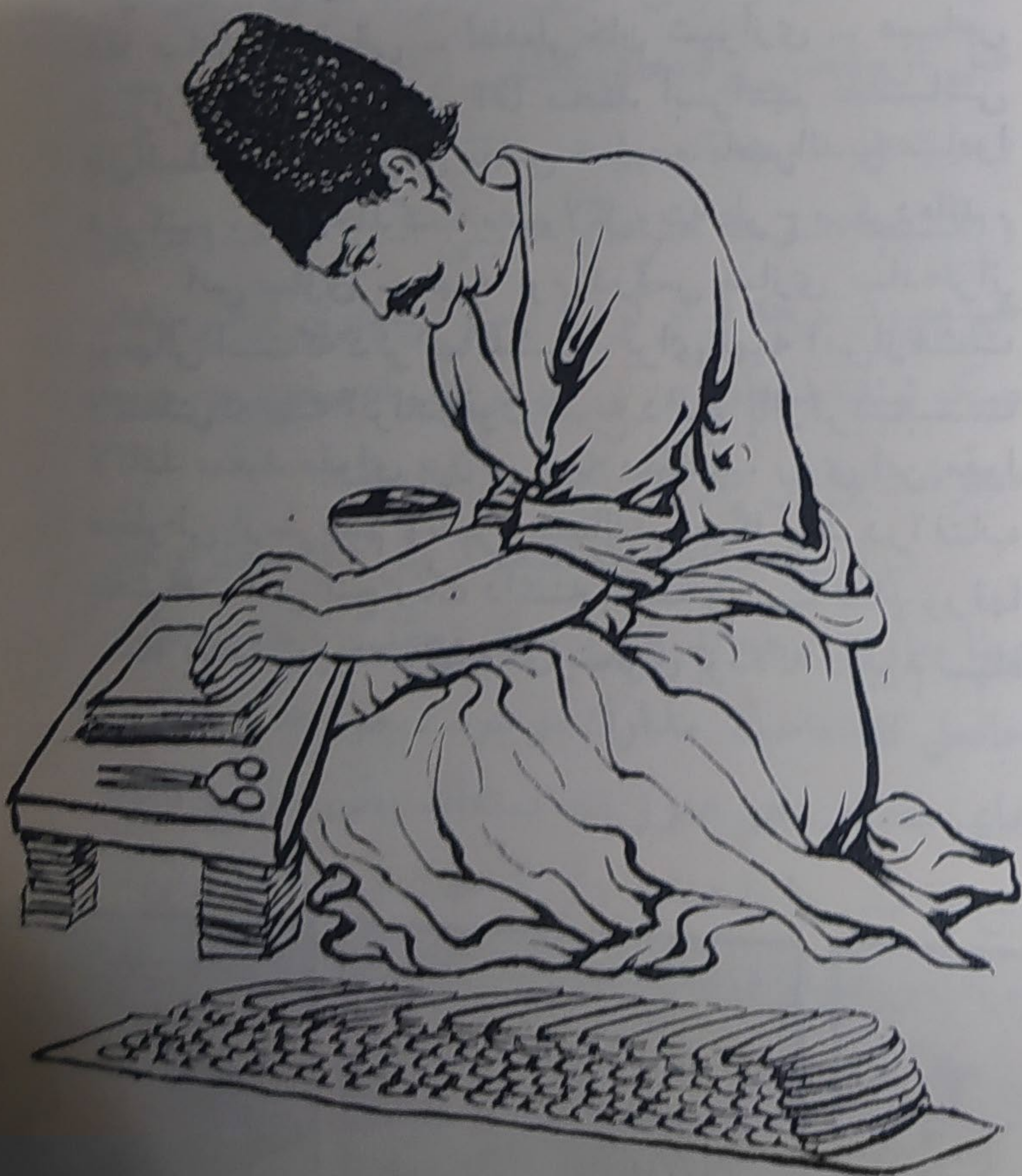
قالب گیری قلمدان