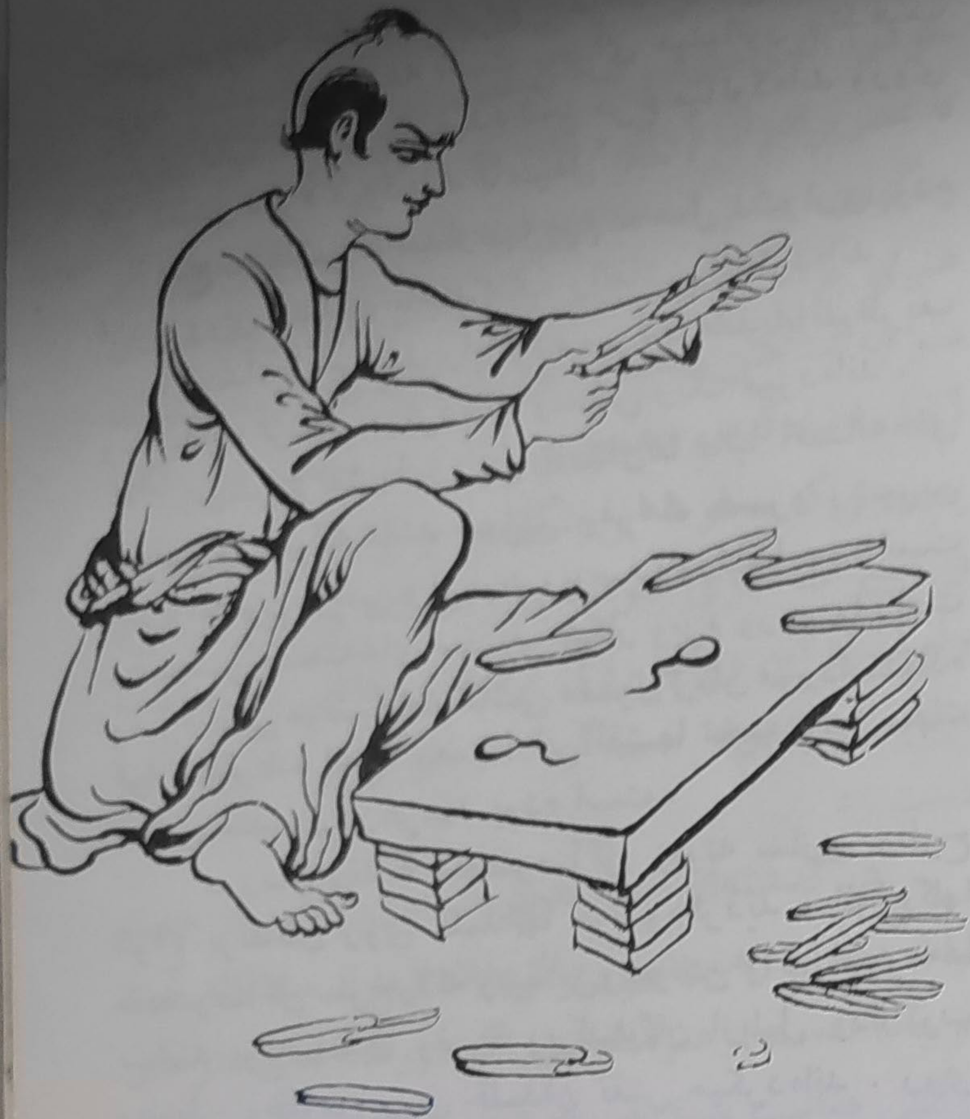
جدا کردن قالب از رویه قلمدا

چنانکه ملاحظه شد بوم سازی در ایران با وسایل بسیار ابتدائی انجام میگردد است ولی با همین وسایل بدوی پیشینیان ما چنان آثار نادر و زیبایی بوجود آورده‌اند که ما اینک با داشتن وسایل علمی و فنی از ایجاد نظائر آنها عاجزیم . البته شرایط زمان و مکان و سهولت عرضه وسایل ماشینی غالب این آثار را منسوخ ساخته است . وشک نیست که در حال حاضر که وقت طلا شده است نیاز بهم بساختن آنچه گذشت با اینهمه صرف وقت و دقت نیست . بومهایی که ذکر شد در غالب صنایع کاغذی