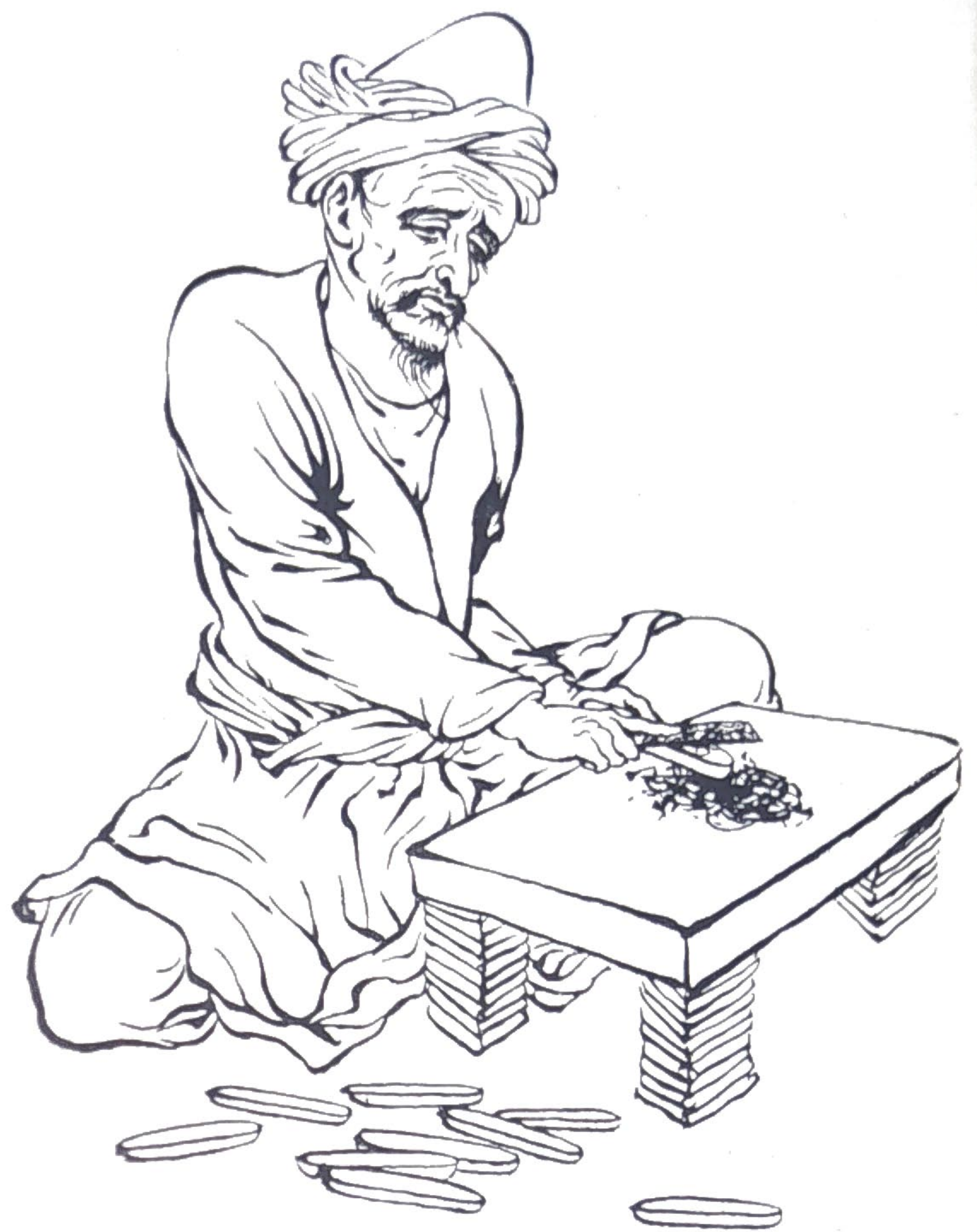
بوسیله سوهان بایستی سطح خارجی قلمدان را هموار کرد .

۳ بوم موجی - مخلوطی از قلع کوبیده محلول در آب سریشم داغ و رقیق روی سطح قلمدان یا جلد کتاب میکشیده‌اند و با سنگ یشم مهره میزده‌اند . زمینه با این عمل بسان نقره براق میشده است . روی این زمینه (۱) مرقش (بفتح میم و قاف) باید همان «مرقشیا» باشد که بنقل از برهان قاطع بعربی حجرالنور گویند .