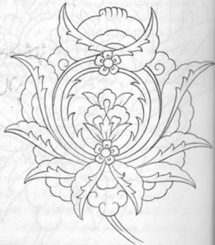
گل شاه عباسی (معروف پسه سره) مخصوص قالی .