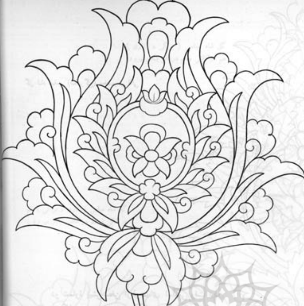
گل شاه عباسی (دو گل درهم) متناسب تر برای قالی.