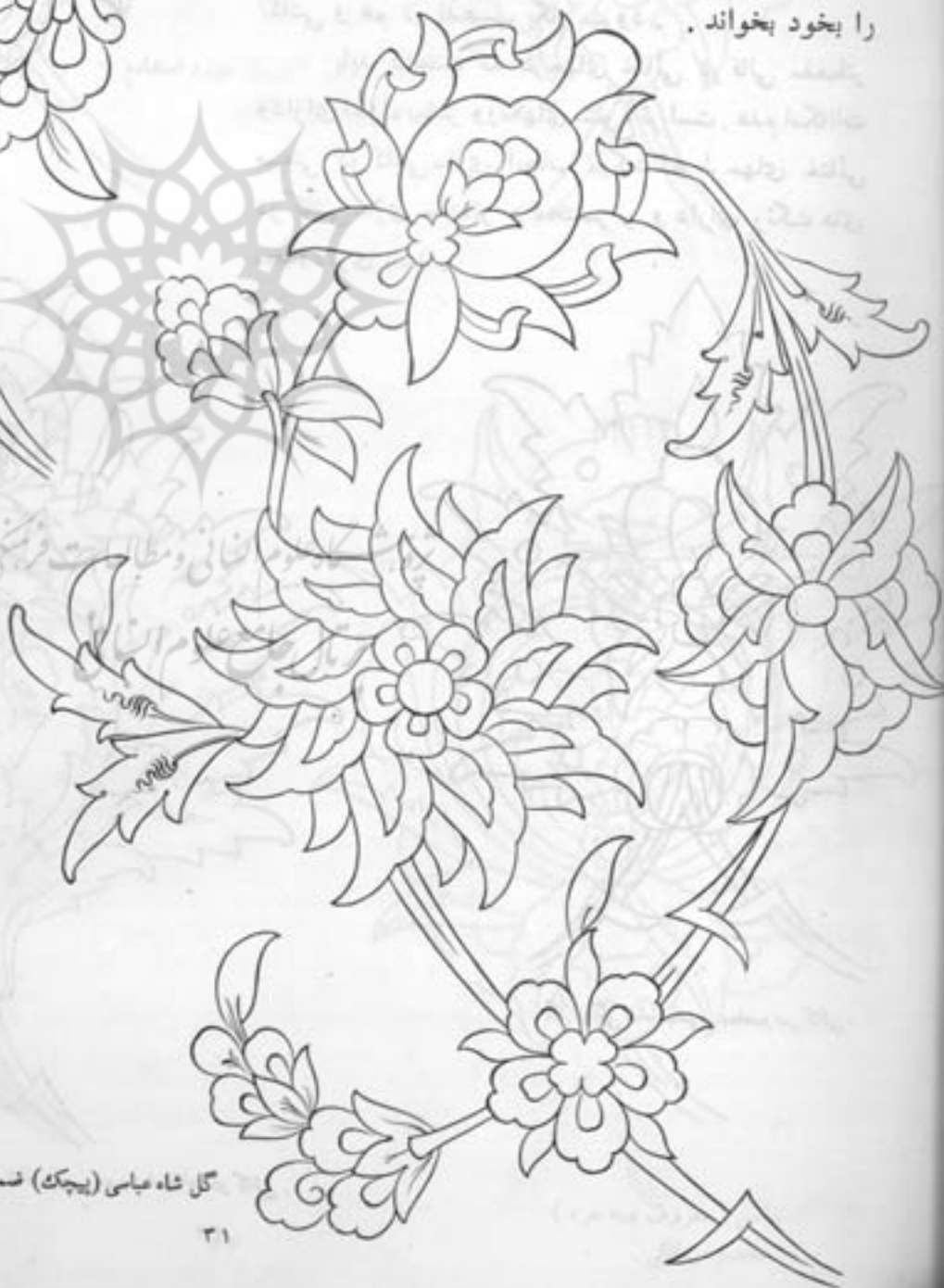
گل شاه عباسی (پیکک) ضمن یک طرح جالب ختائی.