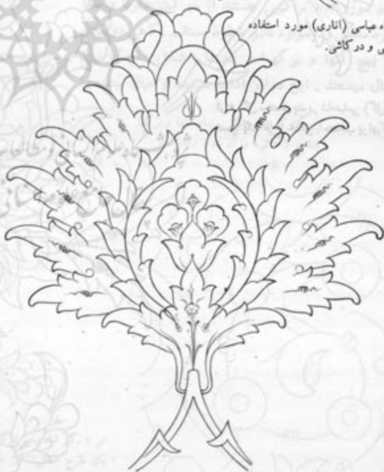
گل برگ‌گی شاه عباسی مورد استفاده در کاشی.