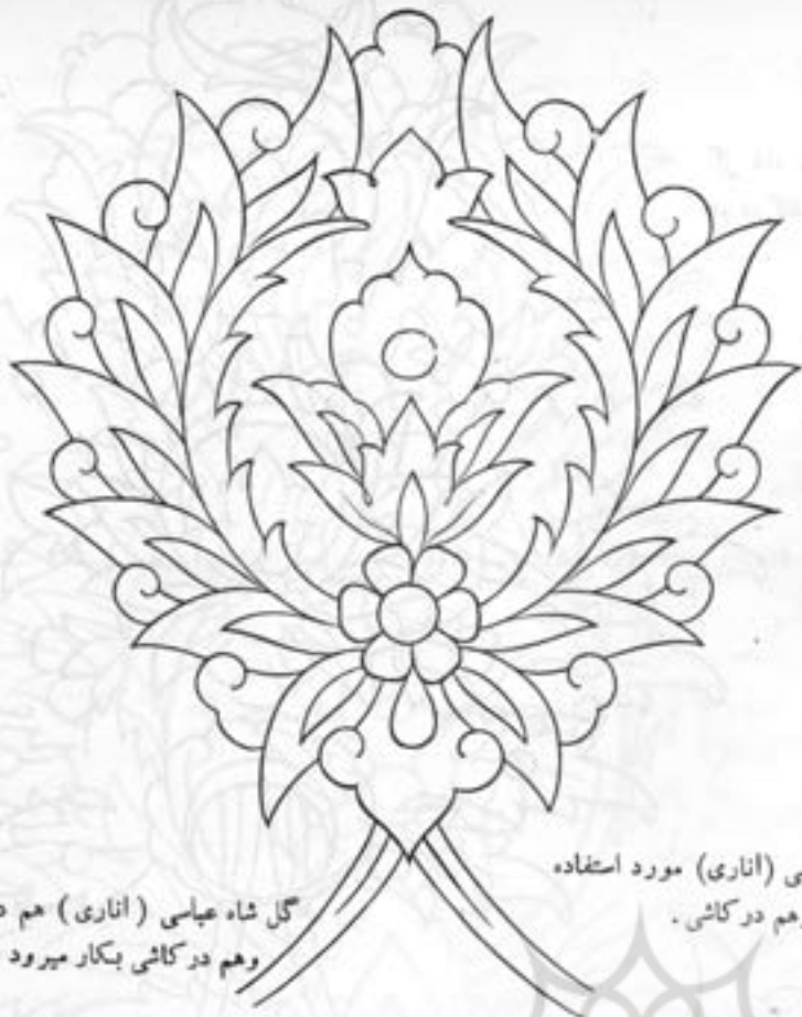
گل شاه عباسی (اناری) هم در قالی و هم در کاشی بنکار می رود .