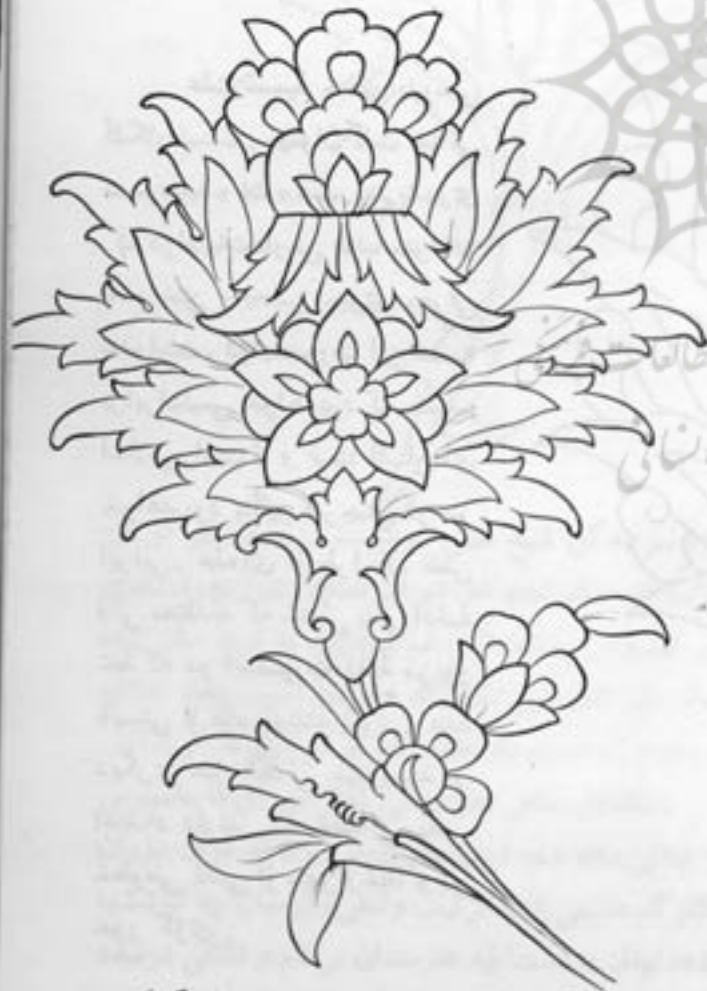
گل شاه عباسی (پرگی) هم در قالی و هم در کاشی مورد استفاده است ؟ متنی بیشتر در کاشی .