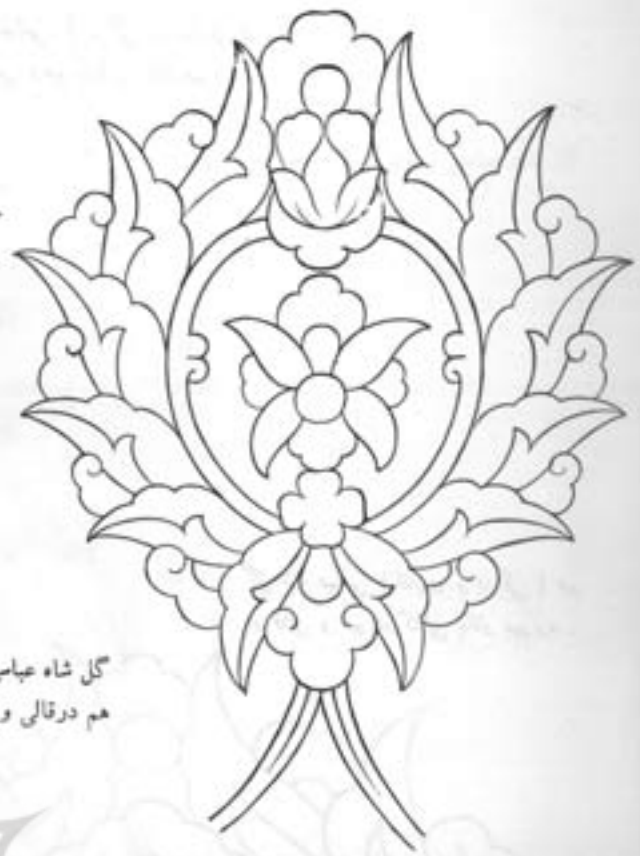
گل شاه عباسی (اناری) مورد استفاده هم در قالی و هم در کاشی .