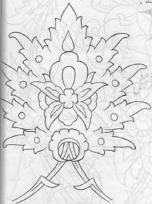
گل برگ‌گی شاه عباسی - مخصوص کاشی.