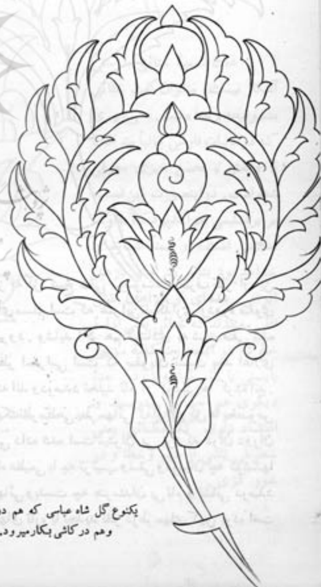
یکنوع گل شاه عباسی که هم در قالی و هم در کاشی بکار میرود.

تا هنرهای پلاستیک (قالی و کاشی و دیگر هنرهای ظریف) ایرانی را بصورتی درآورد که امروز شهر اصفهان پنهانی، عالیترین موزه آنها را بر در و دیوار خود بچشم جهانیان می کشاند. کار اساسی و بسیار مهم در بحث راجع به هنرهای ایرانی این است که بدانیم چه تشکیلات وسیعی، با چه بودجه ای و با صرف چه همت هائی و بدست چه کسانی و بسرپرستی کدام هنرمندان در دوران صفوی وجود داشته و چه شده است که آن تشکیلات و آن رونق بازار چنین شکسته؟ آیا تاریخ نویسان این همت را خواهند داشت که ازین دوره درخشان هنری برگه های تازه ای بدست ما بدهند؟