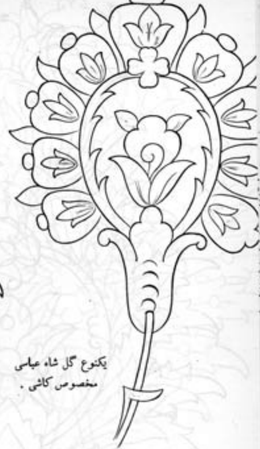
یکنوع گل شاه عباسی مخصوص کاشی.