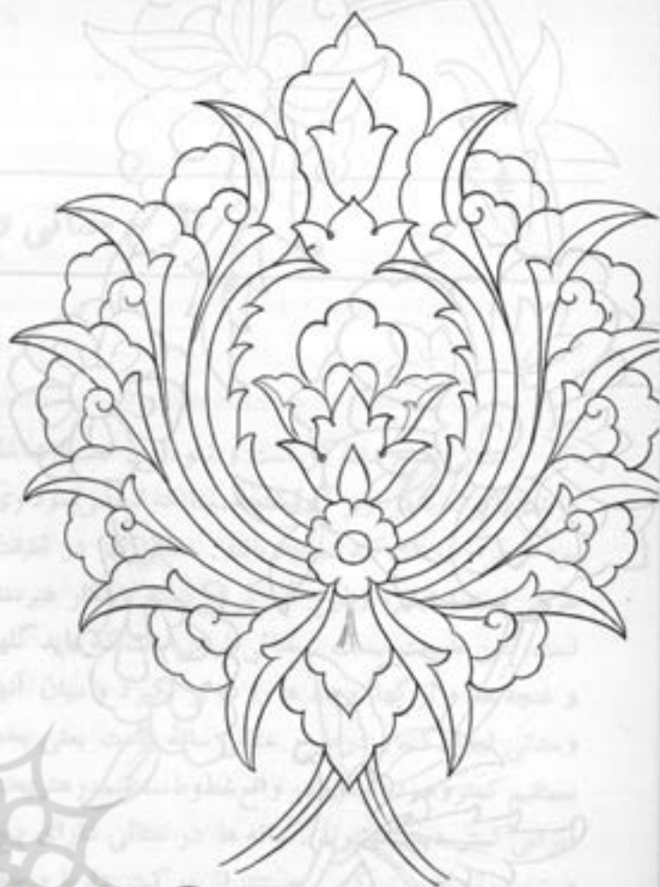
گل شاه عباسی (اناری) مورد استفاده در قالی و در کاشی.

طرحهای ختائی هم مانند اسلیمی‌ها به تناسب فضا و طرحهای هندسی روی سطح اثر هنری می‌بخزند. هنرمند ایرانی برای پر کردن نقشه یک قطعه قالی و یا یک قطعه کاشی و یا یک قطعه تذهیب از بکار بردن طرح‌های ختائی ناگزیر است. زیرا طرحهای مزبور وسائل هستند برای ایجاد نظم و وحدت میان اجزاء اثر هنری او، میان گلها و برگها و غنچه‌ها که پیش از هر نقش دیگری مورد علاقه اوست. بنا بر این ختائی هم در قالی و هم در کاشی و هم در تذهیب بکار می‌رود. باید دانست که طرحهای ختائی در قالی مفصلتر و دارای اجزاء بیشتر و رنگهای متنوع‌تر است. عدم امکانات صنعتی در کاشی‌سازی ایجاب میکند که طرحهای ختائی در کاشی‌سازی ساده‌تر و مختصرتر و دارای رنگ‌های محدودتری باشد.