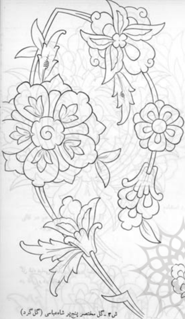
ش ۳ - گل مختصر پنج پر شاه عباسی (گل گرد) ضمن یک طرح ختائی. مناسب برای کاشی.

با خود میکشاند. و گاهی نیز منحنی ای شکسته و گاه درست ( اشکال ۲ و ۳ و ۴ ) عرصه جلوه گل ها و برگها میشوند. در طرح ختائی چند نکته اساسی مطرح است : - اول آنکه طرح ختائی معمولاً بسبک تند و کند است. یعنی قسمتهائی از طرح ساقه ضخیم تر و قسمتهائی نازکتر است. چنانکه در طبیعت هم ساختمان ساقه گل چنین است. قاعده درختائی طرح ساقه ابتدا قوی تر است و آنگاه که ساقه ختم میگردد طرح ظریفتر و نازکتر میشود. - دوم آنکه معمولاً طرح ختائی برای جلوه دادن به یک « گل اصلی » است و این گل باید در قسمتی از ختائی قرار بگیرد که نقطه نظر و اساس طرح باشد و تمام توجه بیننده را بخود بخواند.