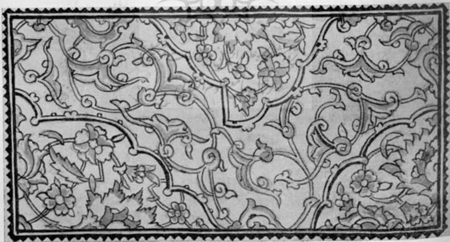
اصلی طرح خرم‌طوم فیل