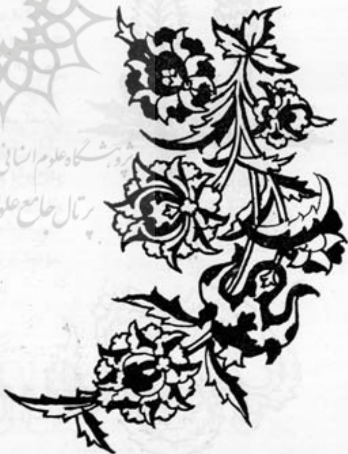
گل شاه عباس

۳ - از کرمهائی که در کناره دریای گرمسیر زندگی میکنند و شبیه خاکشیر است . این کرمه‌ها هم بزرگی یک نخود می‌رسند و ساحل نشینان این کرمه‌ها را جمع می‌کنند و خشک کرده بمصرف رنگرزی می‌رسانند ( از تحفه حکیم مؤمن نقل یمنی و از اطلاعات قالی بافان متخصص ) .