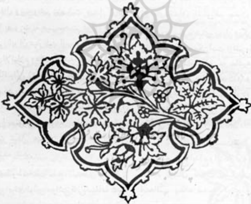
طرح معروف به ترنجی (در وسط برگهای مو طراحی شده)

اکنون پشم های رنگین بدار قالی آویزان است قالی بافان در برابر دار نشسته اند و نقشه پیش روی آنهاست و قالی را کله کله میبافند تا شما آنرا زیر پای خود بباندازید.