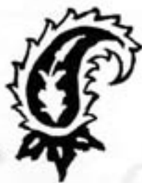
بته جفته طرح کاشان

میتوان شاهکارهای جاویدی از هنرمندان شکبیا و صبورا ایرانی درموزه‌های «متروپولیتن» در نیویورک «ارمیتاژ» در لنین‌گراد «ویکتوریا و آلبرت» در لندن، «قیصر فردریک» در برلن، «لوور» در پاریس و موزه «صنایع و هنرها» در وین تماشا کرد. اکنون باید دید علت زیبایی قالی ایران چیست و چه عامل یا عواملی باعث میشود که ما یک قطعه خوش ساخت و بافت قالی را شاهکار صنعت مینامیم؟