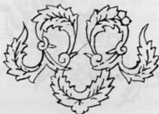
اصلی بازیست برگهای طراحی شده