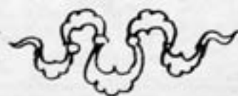
اسلیمی شیه به پیچک