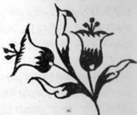
یک نوع لاله طراحی شده