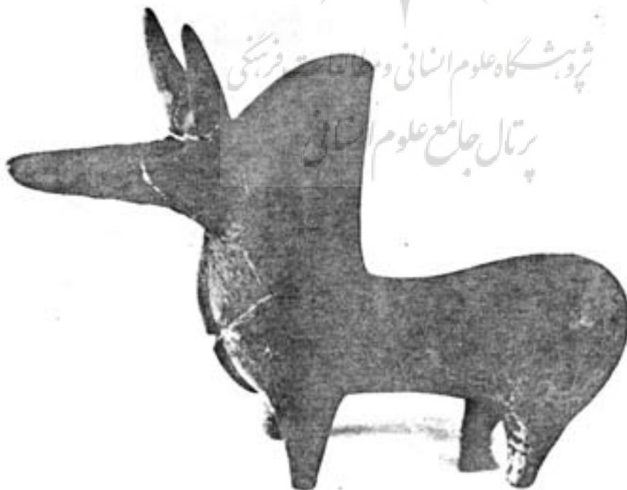
«جسمه سفالی گاو کوهاندار - مربوط بقرن هشتم قبل از میلاد «مارلیک» رودبار گیلان»

این یادداشت‌ها که دربارهٔ کاوش‌های باستانشناسی نوشته شده کسب فیضی بود که نگارنده در طی سالیان دراز از محضر استادان عالی‌قدر باستانشناسان ایرانی که برای حفاری به مناطق گیلان سفر میکردند برده است. بی‌هیچ ابائی شك نیست این یادداشت‌ها بی‌عیب و نقص نخواهد بود. اما من دل بر آن داشته‌ام که استادان چیره‌دست و مسلم روزگار خرده بر صاحب این قلم نخواهند گرفت چرا که هرچند بررسی اجمالی و مختصری است ولی باز نکاتی در این مقال به‌زبان قلم آمده که روشنگر پاره‌ای از تمدن باستانی این سرزمین کهنسال است شاید که این یادداشت‌ها انگیزه‌ای شود که اندیشمندان از این سرزمین پهناور باستانی یادی نمایند تا مشتاقان را چراغی فرا راه تاریکی‌های تمدن آریایی باشد.