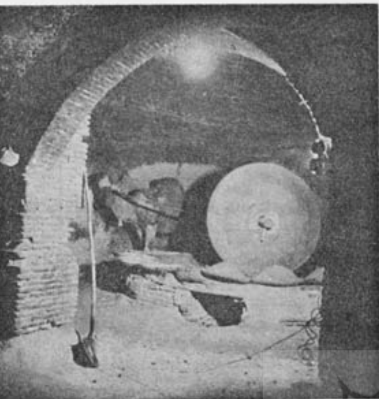
عملیات سائیدن دانه‌های روغنی بوسیله سنگ.

دو چرخ بزرگ از چوب چنار و یک چرخ کوچک از چوب کوکن و یا وشه است. دو سنگ لاسو نیز در زیر و روی آسیا به کار رفته است. سنگ زیرین حالت مفروش دارد و سنگ زیرین بوسیله میله‌ی آهنی بر روی چرخ کوچک (کرتا) استوار میشود. گردش سریع کرتا سنگ زیرین را میچرخاند.