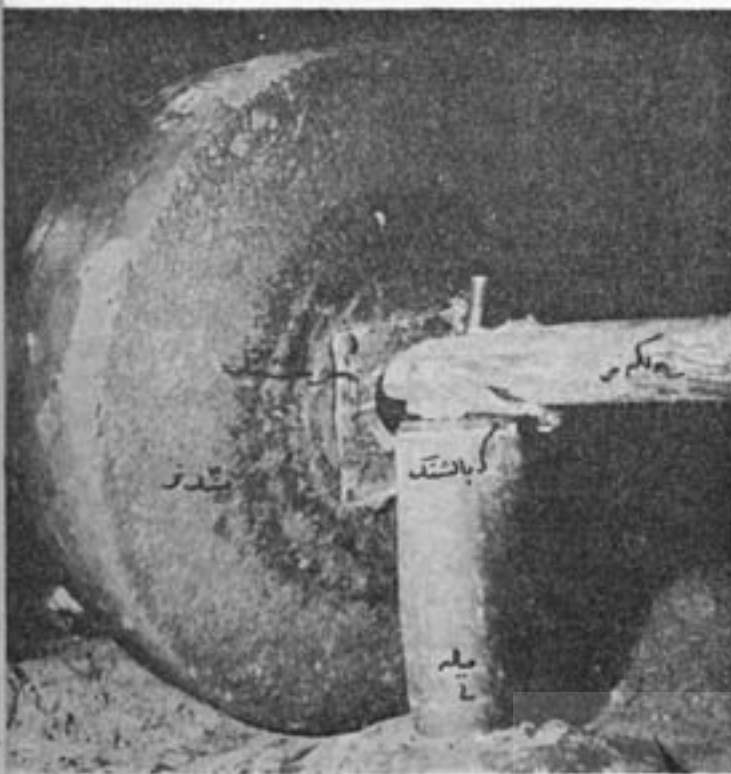
سنگ عصارخانه و تخمیر (له‌کردن) دانه‌های روغنی.

نخست کوبی‌های مملو از خمیر دانه‌های روغنی را یک‌پایک برویهم می‌چینند و با استفاده از تیر کوچکی بنام کارماله کمی