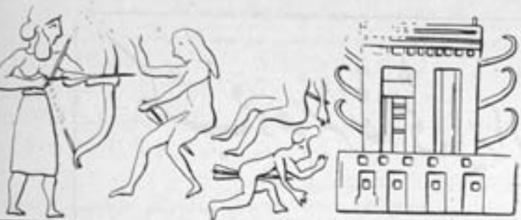
۵- طرح يك معد بسیار مهم درشوش .

محل سکنی از گل و سنگ استفاده میشد ولی با اختراع آجر اینبه مهم معابد وقلاع ازسنگ و آجر وستونها و پایه های محکم ودرگاهها ودرها و پنجرهها وتزیینات دیگر چون ستون و برآمدگی در قسمتی از بنا که ساختمان زیبایی و برزندگی میداد صورت گرفت .