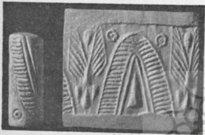
۶- مهر دوره هزاره چهارم ق . م .

در کاوشهای شوش مهري که متعلق به اوائل هزاره چهارم است کشف شده است که طرح يك کلبه از نی وحصیر برآن منقوش است واین ابتدائی ترین نوع محل سکونت بوده که آثار آن هنوز باقی است ودر روستاها مشاهده میشود . از مهر های بسیار مهم و جالب توجه چند مهر است که یکی چوپانی را درحال راندن چهارپایان سوی آغل یا طویله نشان میدهد . دیگری خانهای با پنجرههای متعدد یا دری که دستگیره دارد وزنی مقابل آن نشسته یا پنجرهها ودرها بوسیله حصیر پوشانده شده که سرما وگرما نفوذ نکند . نقوش متعددی از معابد وانبار غلات را در حالیکه مأموری مشغول حمل کردن غله و پرکردن سیلوهاست نشان میدهد . از جمیع این نقوش میتوان بطور صحیح و یقین بدون تصور وتخیل تاریخ جامعه کهن ووضع زندگی مردم سرزمین ماکه درطی دوران در مقابل سختیها و شدائد مادی و طبیعی و معنوی مقاومت ورزیده و برآز زندگی بهتر ومرفه دست یافته وبه اختراعات مهم واكتشافات درشئون مختلف نائل گردیده است پرداخت .