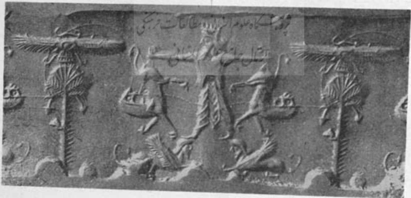
۷- مهر هخامنشی سلطنتی از مجموعه پیرپون مورگان .