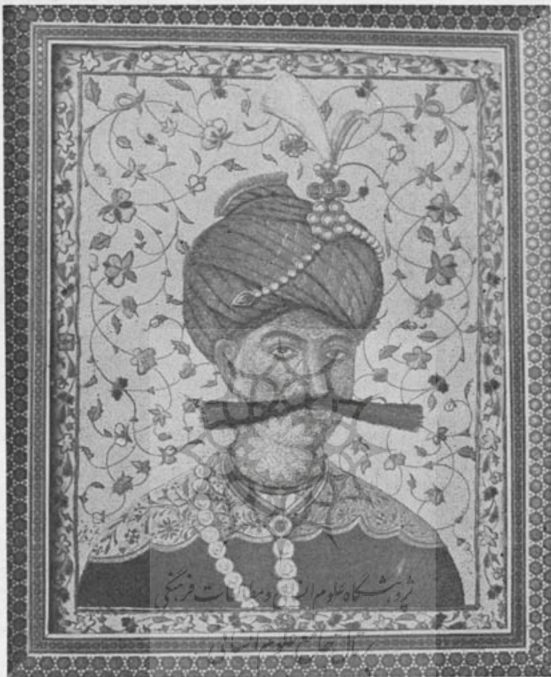
تصویر ابریشمدوزی شاهعباس کبیر کار نیره مؤیدپردازی صیبه مؤیدپردازی معلم هنرستان دخترانه دربارشاهنشاهی

تا اینجاموید پردازی بموضوع فعالیت های تعلیماتی خود بعنوان يك استاد نقاشی اشاره ای ننموده است و بدنبال سؤال من در این زمینه میگوید: «درسال ۱۳۱۰ دست روزگار مرا بمشهدکشانید و در همین سال بدنبال تحولانی که دروضع استخدامی من روی داد تعلیم و تدریس نقاشی در مشهد بمعهد من محول گردید و من این کاررا مدت ۱۴ سال در مشهد