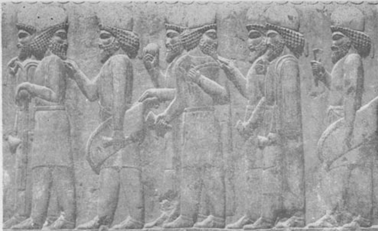
هیئت عمومی قوم آریائی معروف (به مادی) - تخت جمشید

اینک ، اکثر محققان ، بنا بر دلایلی ، قطعی مهاجرت را همان شمال سبیری میدانند ، و اروپا را بکلی کنار نهاده‌اند .