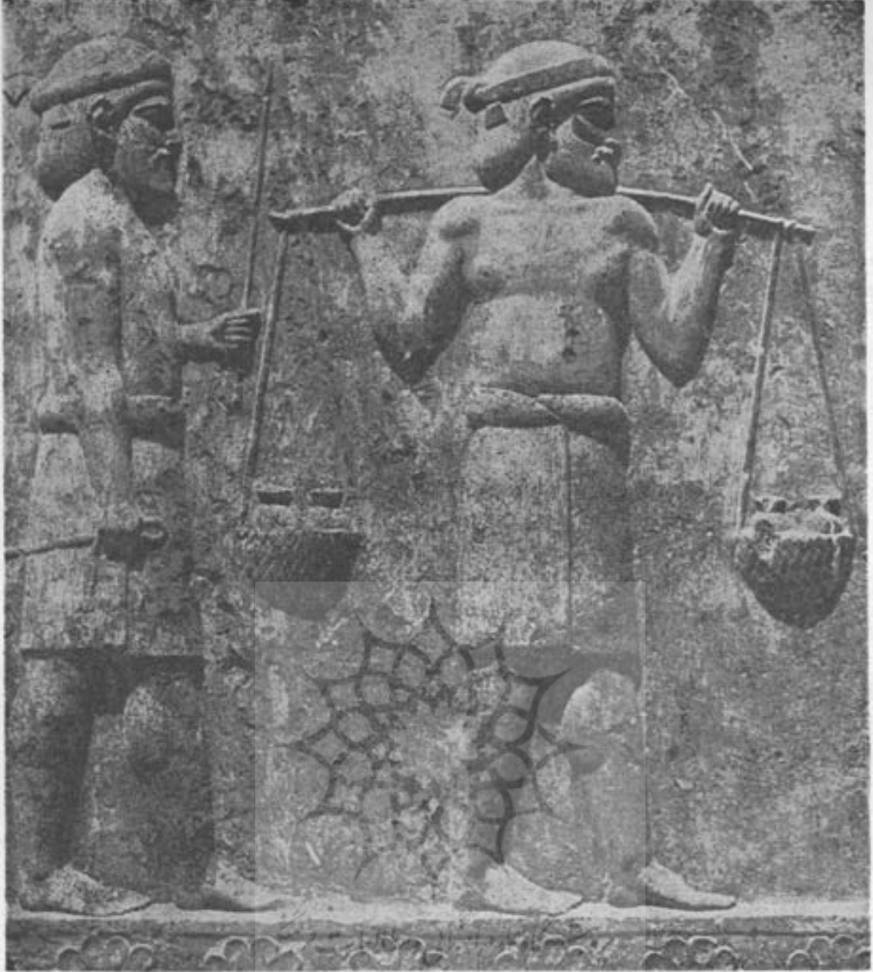
هیئت عمومی پاك آریائی هندی - تخت جمشید