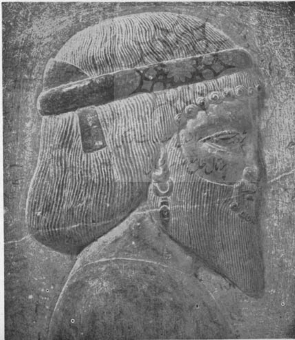
نمونه‌ی يك چهره‌ی هند و آریائی - بلخی - تخت جمشید

درباره‌ی آریاها، اصل مرافعه ابتدا بر سر نقطه‌ی اصلی مهاجرت این قوم بوده است. برخی، اقامتگاه اصلی آریاها را در اروپا میدانستند و جمعی در آسیا (شمال سبیری) میگفتند.