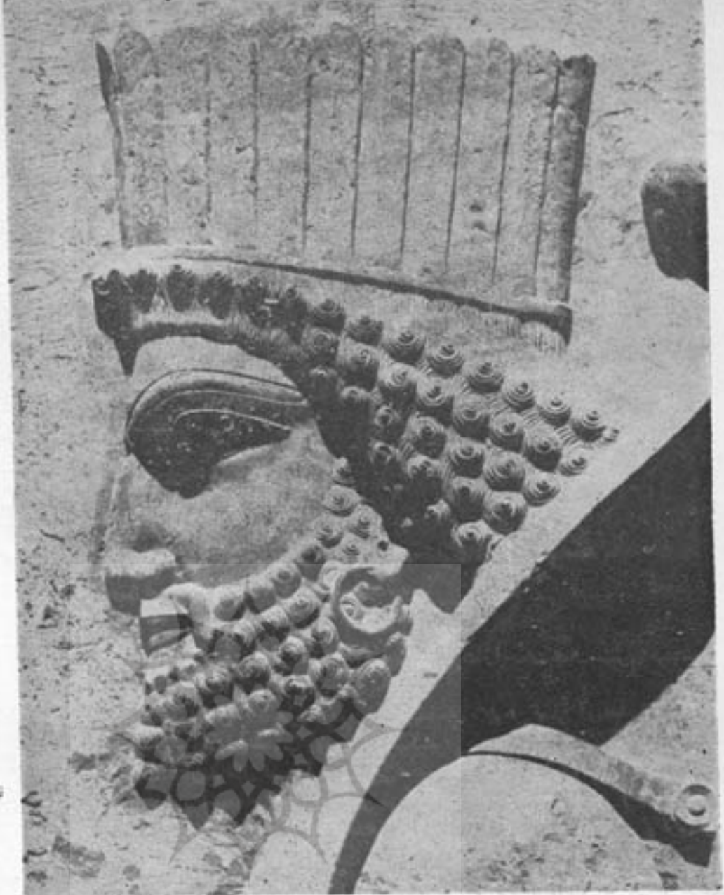
نمونه‌ی يك چهره‌ی آریائی از قوم پارس - تخت جمشید

که در اواخر عهد چهارم، سبیری از اروپا جدا بود. وسیله‌ی این جدائی، وجود دریاچه‌ی بزرگ آرال و خزر، و بقایای یخچالهای روس و اسکاندیناوی، و همچنین یخچالهای ایران و آلتائی بود. جامع علوم اسلامی بمحض اینکه خشکی باطلاقیهای آرال - خزر، و ذوب یخچالهای اورال و هندوکش شروع شد، و هوای سبیری رو بسردی نهاد، این اقوام بمهاجرت پرداختند، و دسته دسته به جانب روسیه و مغرب، و یا بطرف ایران حرکت کردند.