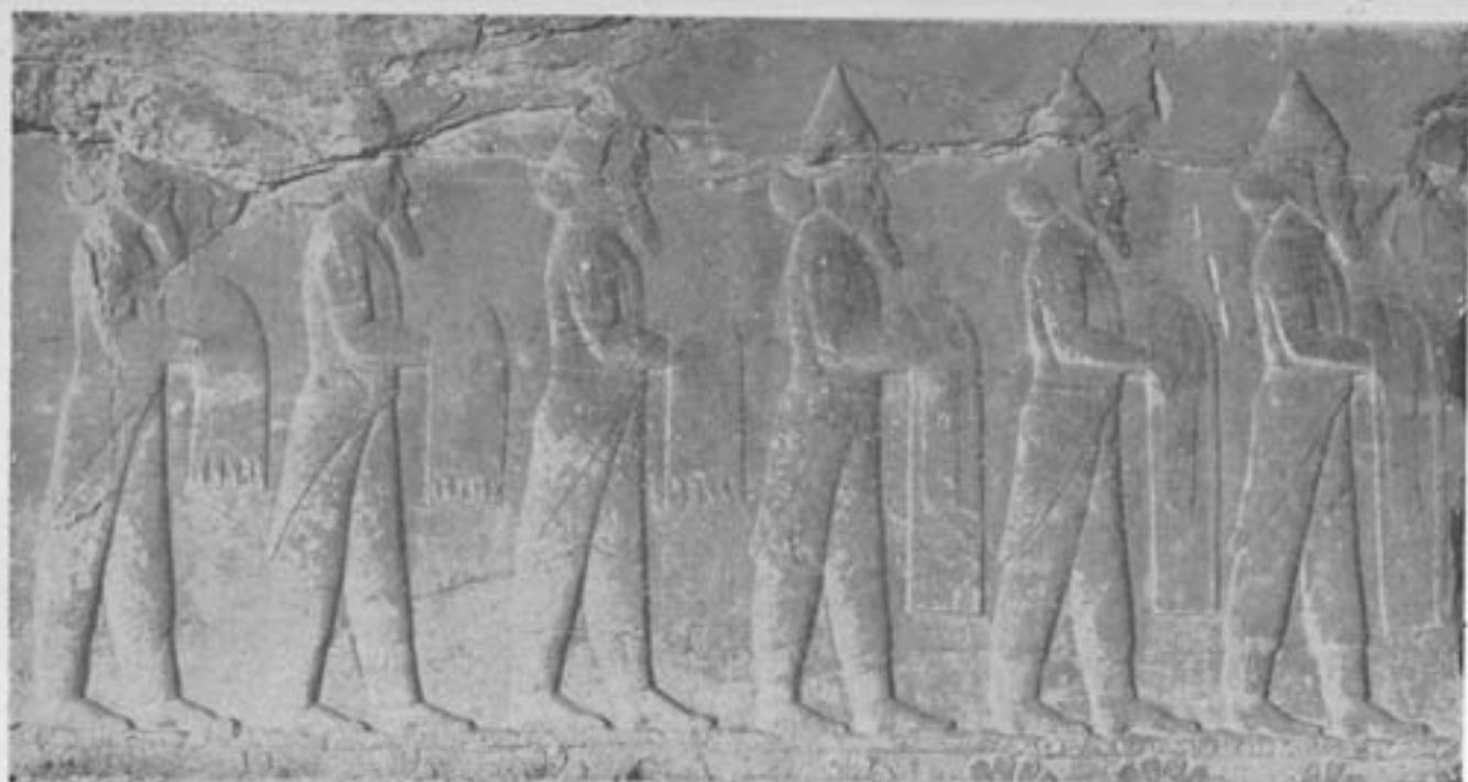
هیئت عمومی سوغدی‌ها

ایرانیان، طی چهارقرن بعد، قوم بومی اصلی را مستهک کردند، و تمدن مخصوص خود را بر روی تمدن مزبور (فرهنگ همسایه) بنا نهادند.