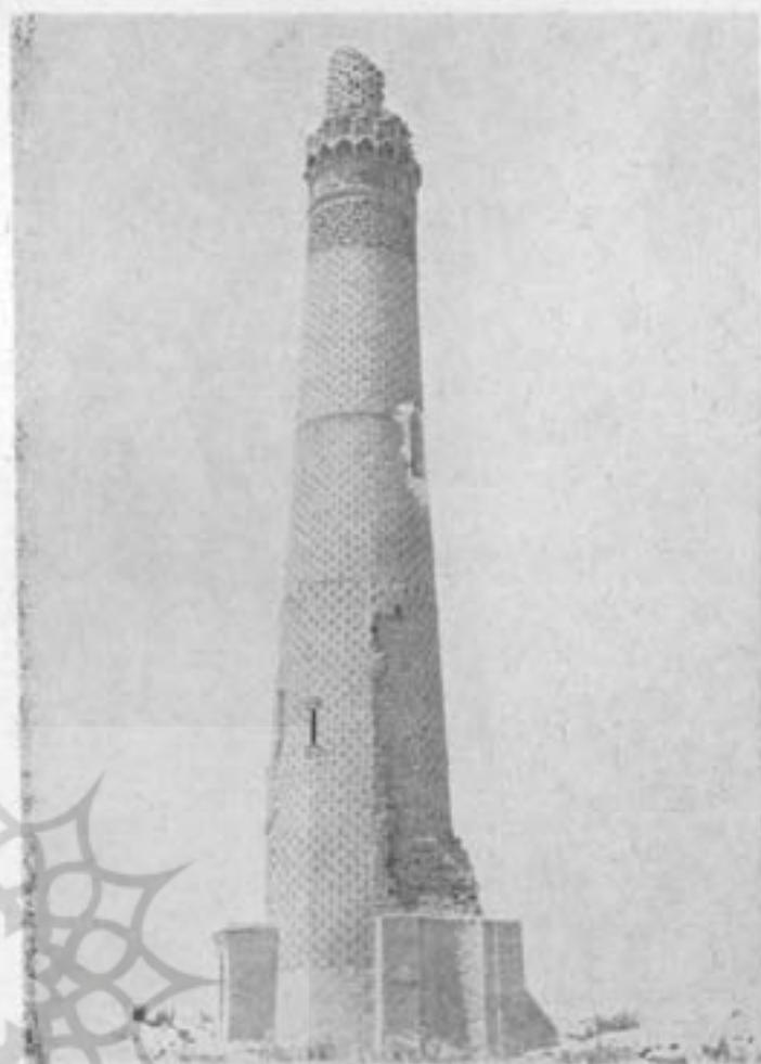
میل ابار - سنگ بست خراسان - قرن چهارم

کوریت گوید: مؤذنه‌های اسلامی خیلی به سایه‌بانها و بادگیرهاییکه روی بامهای منازل ساخته میشده شبیه است. دیز گوید: مؤذنه‌هاییکه در ایران و هند است از روی