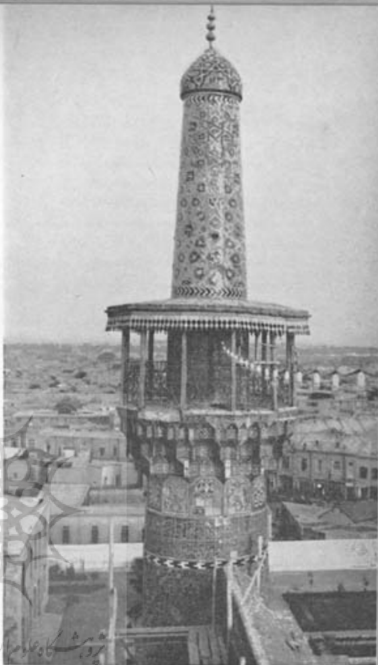
مناره مسجد جامع گوه‌ر شاد مشهد . ۸۲۱ هجری

خلاصه فکری اینکه مؤذن در محل مرتضی اذان بگوید مسلمانان را بر این نداشت تا برای مؤذن جایگاه مخصوصی که بلندتر از مسجد و متصل یا نزدیک بآن باشد سازند تا همیشه در آنجا اذان گفته شود . و چون دولت اسلام توسعه یافت و مسلمانان با کشورهای متبذین آفرود تماس پیدا کردند ، ضرورت ایجاد کرد تا در هر شهر مسجدی و جهت هر مسجدی مؤذنه‌ای سازند و در ایران نحوه ساختمان مساجد عربی بصورت و شکل بناهای مذهبی ایرانیان درآمد . چه از همان ابتدای اسلام در