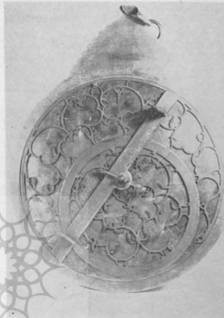
شکل ۴ - اسطرلاب برنجی - قرن دوازدهم هجری