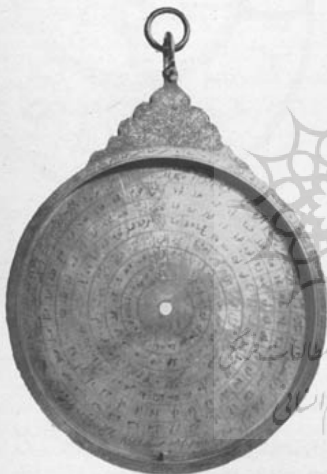
شکل ۱ - جزئی از اسطرلاب که حجره یا ام گویند می‌شود

اسطرلاب لفظ یونانی است یعنی ترازوی آفتاب (اسطر ترازو و لاب آفتاب)، برخی این کلمه را فارسی میدانند بمعنای ستاره‌یاب که با آن اعمال نجومی از قبیل تعیین ارتفاع ستارگان، آفتاب، تشخیص زمان، تقویم سیارات، آشنائی بطالع انسانی، تقویم سیارات و قوس‌النهار کواکب و سایر امور فلکی را معین می‌سازند.