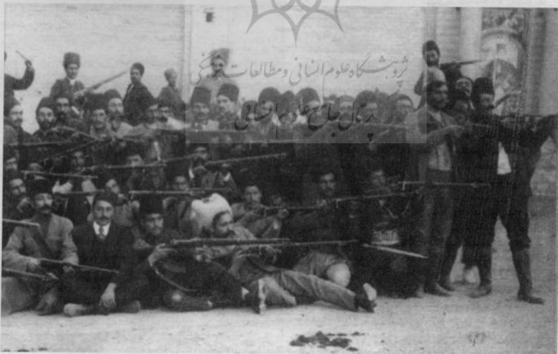
جنگ مجاهدین ارامنه بیرم خان در شاه آباد نزدیک تهران (کتابخانه مجلس، ۲-۱۲/۶ ق)

یکی از مشکلاتی که در مورد انتخابات پیش آمده بود، به ارمنیان، زرتشتیان و یهودیان ایران اجازه انتخاب نماینده نداده بودند. (۴) ارمنیان و زرتشتیان در صدد چاره‌جویی برآمدند و نامه‌هایی به