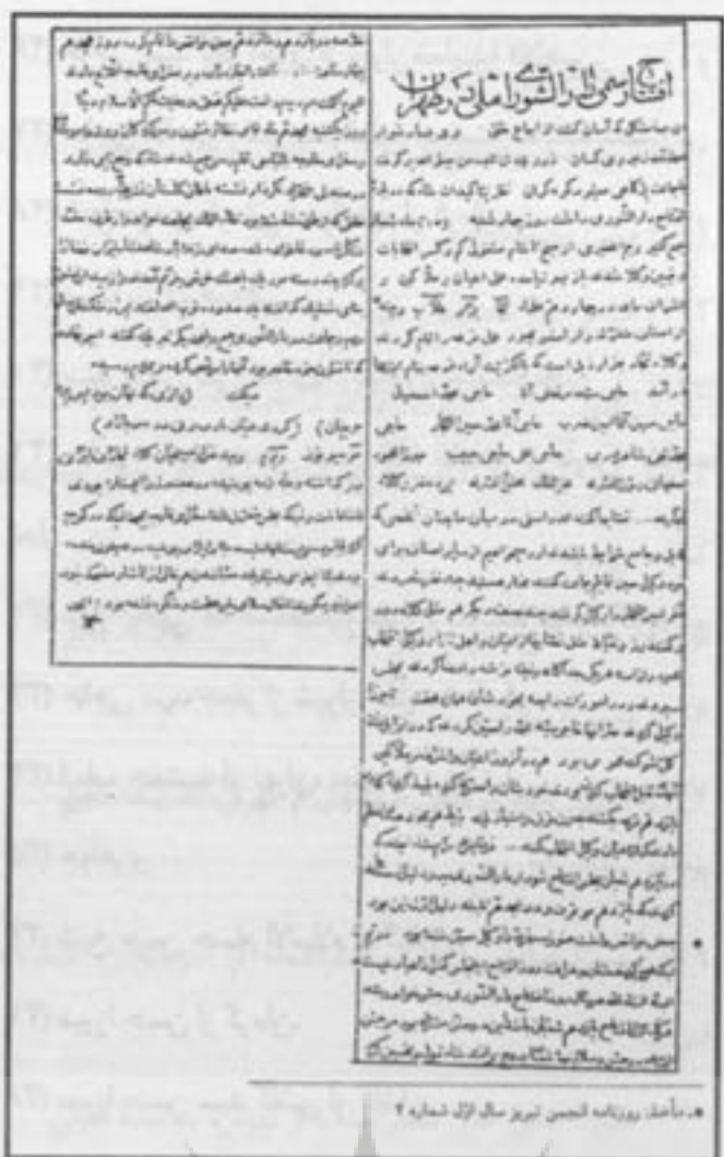
... مآخذ: روزنامه انجمن تیرماه سال اول شماره ۴

مجلس اول پیش از پایان دو سال دوره قانونی خود، به علت مخالفت‌های محمد علی شاه با مشروطه خواهان و تحریکات دولت‌های خارجی از طریق عناصر ارتجاعی، توسط کلنل لیاخوف رئیس قزاق‌های ایران و چند افسر روسی دیگر در روز دوم تیر ماه ۱۲۸۷ ش به توپ بسته شد و چندتن از نمایندگان و روزنامه‌نگاران و مشروطه طلبان در باغشاه زندانی شدند، عده‌ای از آنها به قتل رسیدند و عده بسیار دیگری از نمایندگان نیز به سفارت‌خانه‌ها پناهنده شدند، با این کیفیت دوره اول مجلس شورای ملی منحل و حکومت نظامی در سراسر