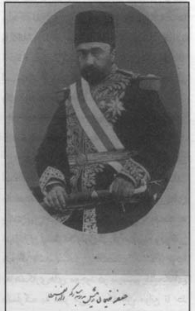
جعفر ضیاء الدین میرزا تقی خان امیرکبیر

تأسیس مدرسه دارالفنون در دوره ناصرالدین شاه قاجار و به توصیه و صلاحدید میرزا تقی‌خان امیرکبیر در سال ۱۲۶۸ (ه. ق) را می‌توان نقطه