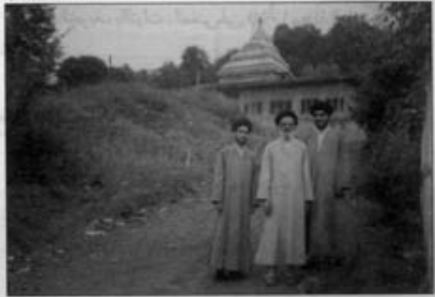
۶۳- هیئته و الاسلام، سید هبة الدين شهرستانی، چاپ نجف سال ۱۳۸۱ و ۱۳۸۴ هـ. ق