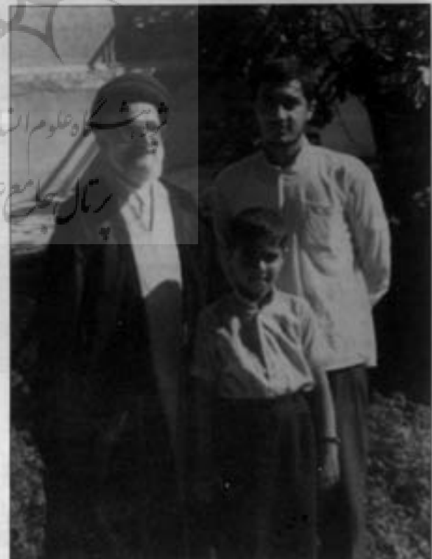
مشهد- منزل اردیبهشت ۱۳۷۰