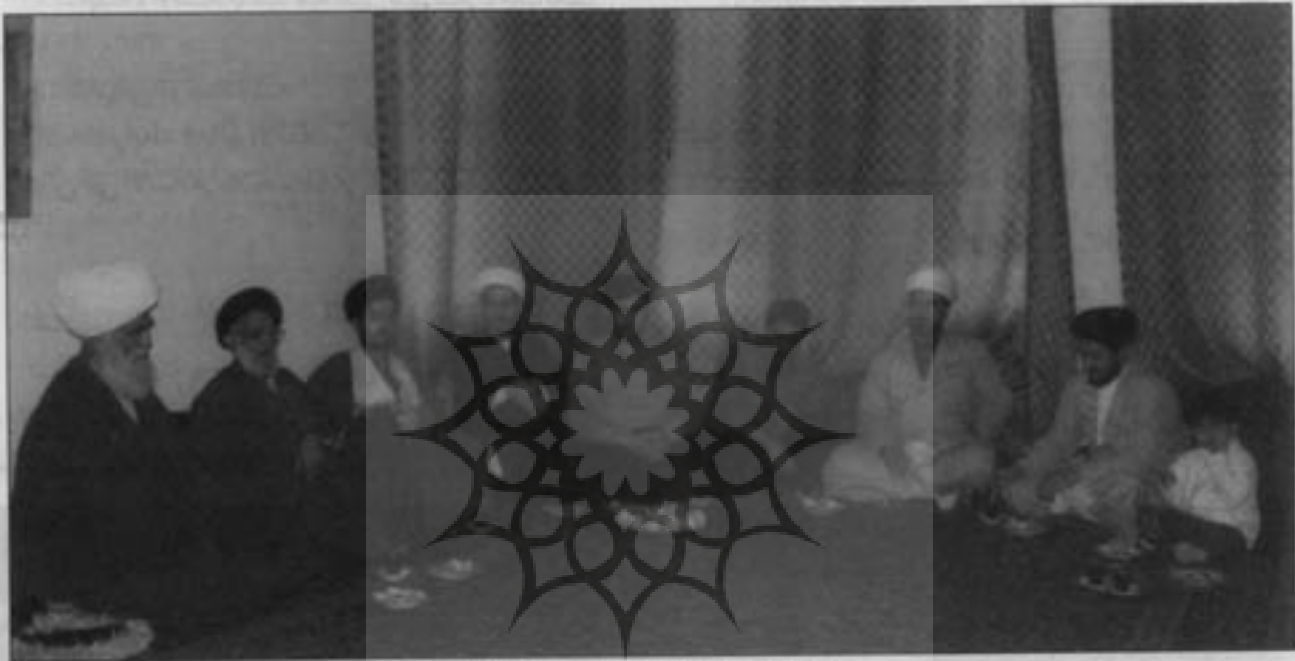
پيغمبر اشرف منزل ايت الله شيخ شمس الدين واعظ