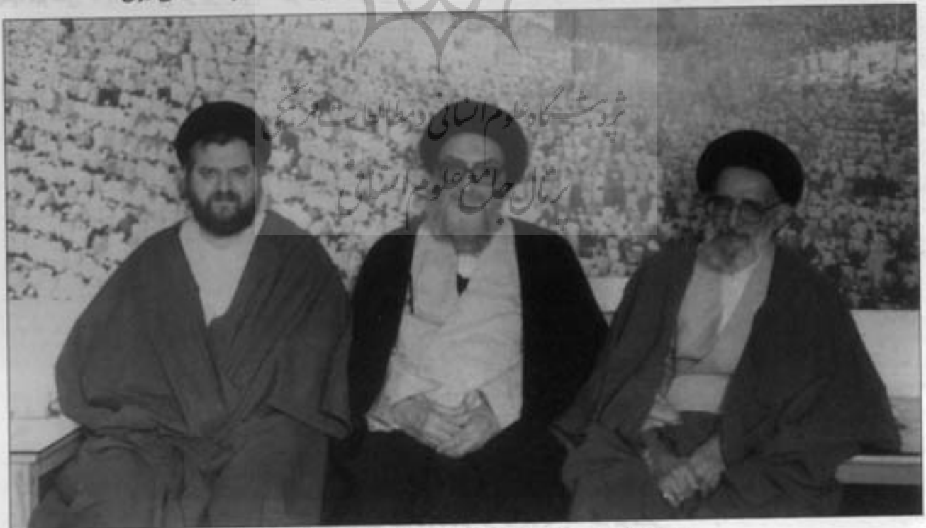
در کنار آية الله سيد محمد علي روشاني حجة الاسلام والمسلمين سيد جواد شهرستاني ۱۴۱۸ قمری

۱۶ - ریاض العلماء و حیاض الفضلاء میرزا عبدالله افندی اصفهانی، چاپ قم سال ۱۴۰۱ هـ. ق. شش مجلد و جلد هفتم در سال ۱۴۱۵ هـ. ق. چاپ شده است. ۱۷ - ست آراجزی، سید علی حسینی میبدی، چاپ قم سال ۱۴۲۵ هـ. ق. ۱۸ - شرح الأرزوزة البطحیة، سید علی حسینی میبدی، چاپ قم سال ۱۴۲۵ هـ. ق. ۱۹ - ضیافة الاخوان، آقا رضی قزوینی، چاپ قم سال ۱۳۹۷ هـ. ق. ۲۰ - فضل زیارة الحسین (ع)، شریف شجری، چاپ قم سال ۱۴۰۳ هـ. ق. ۲۱ - فقه القرآن، قطب رلوندی، چاپ قم سال ۱۴۰۵ هـ. ق. دو مجلد ۲۲ - فهرست آل بویه، شیخ سلیمان ماحوزی، چاپ قم سال ۱۴۰۴ هـ. ق. ۲۳ - قس من تفسیر القرآن الکریم، شیخ علی سماکه الحلّی، چاپ نجف سال ۱۳۹۱ هـ. ق. ۲۴ - کتاب القضاء میرزا حبیب الله الرشتی، چاپ قم سال ۱۴۰۱ هـ. ق. ۲۵ - کشف الریبه عن أحكام الغیبه، شهید زین الدین بن علی عاملی، چاپ نجف سال ۱۳۸۲ هـ. ق. ۲۶ - اللب اللباب فی غریب اللغة و الحدیث و الكتاب، شیخ محمد