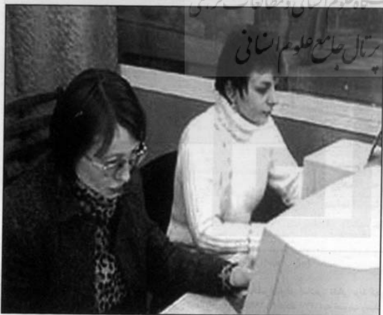
پرتال جامع علوم انسانی

● ما موافق اصول آزادی اندیشه و اعمال عمل می‌نماییم.