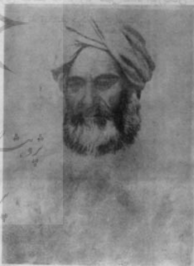
تصویر ابوریحان بیرونی که وزارت سحر، فرهنگ و میراث را برقرار کرده است.

*جناب آقای کاشانی سردبیر محترم نامه بهارستان دو نکته را در مورد این اثر تذکر دادند یکی آنکه مرحوم همایی در ابتدای مقدمه خویش بر این کتاب راجع به چگونگی بدست آوردن این نسخه مطلبی را نوشتند که جالب و خواندنی است. دیگر آنکه نسخه مذکور بعدها به تملک کتابخانه مجلس درآمد و بعدها به قدیمی‌ترین نسخه التفهیم اشتهار یافت.