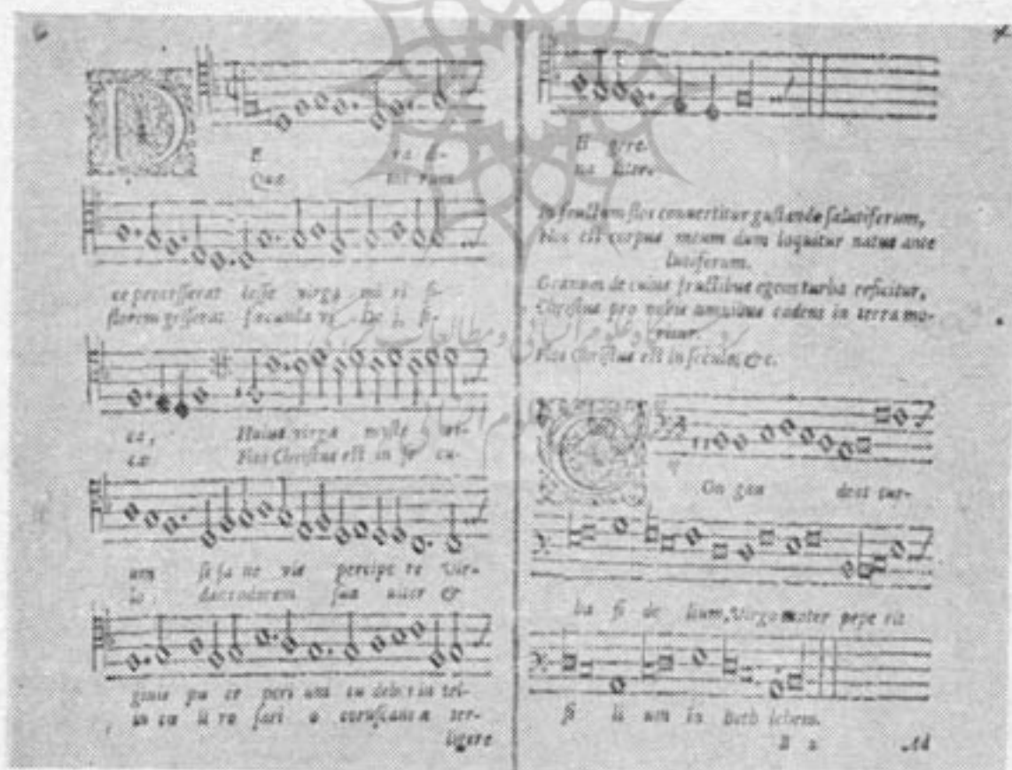
صفحه‌ای از کتاب Piae Cantiones

در قرن نوزدهم طبقه تحصیل کرده فنلاند تحت تاثیر فرهنگ سوئدی‌ها کاملاً «سوئدی» شده بودند و تنها در اواخر این قرن بود که گروهی به زبان و هنر ملی فنلاند توجه کردند بزودی با پیدایش استاد بزرگ موسیقی «ژان - سیبلیوس» ، موسیقی رومانتيك ملی در فنلاند راه یافت . قدیم‌ترین نوع موسیقی در فنلاند موسیقی محلی است . از موسیقی غیر محلی، ابتدا سنن موسیقی اروپای غربی در قرون وسطی (۱۳۰۰ - ۱۱۰۰) همراه با مسیحیت در فنلاند رایج شد و از آن پس آوازهای «گرگوری» در کلیساهای فنلاند خوانده می‌شد . در سال‌های تسلط سوئدی‌ها بر فنلاند ، دربارهای اروپا مشوقین اصلی موسیقی دانان بودند و چون فنلاند درباری نداشت، در نتیجه مراکز موسیقی در آن سرزمین منحصر به کلیسا و مدارس گردید .