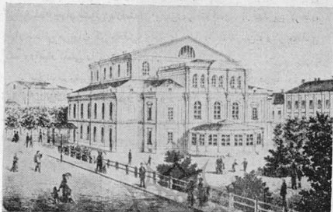
تئاتر بزرگ هلینکی ، ۱۸۷۷

می‌شود. البته صحنه این شهرها دائمی نیست و فقط گاهی برنامه‌هایی با همکاری هنرمندان چند شهر بروی صحنه می‌آید که دیدنی است.