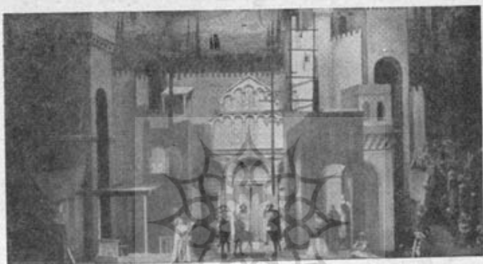
یکی از ابراهای پیشینی در اسکالا

پس از اینکه سال ۱۸۱۴ صحنه ابرارا وسیعتر نمودند در تالار آن ( که تا آن موقع تماشاچیان، ایستاده استفاده میکردند ) صندلی‌هایی قرار داده شد و چلچراغ‌های مجللی جای شمع‌های سابق را گرفت ، سپس چراغهای گاز و بعد از یکسال که در نیویورک نخستین تأثیر با مرکز الکتریکی احداث گردید ، اسکالا نیز سال ۱۸۸۳ با تازمه ترین لوازم و امکانات مجهز شد . لژها و تزیینات داخلی تالار سال ۱۹۳۱ پایان رسید و تادوازده سال بعد که بمب‌های آتش‌زا دیوارهای ابرارا فرو ریخت يك كالری نیز به پنج بالکن آن افزوده شده بود.