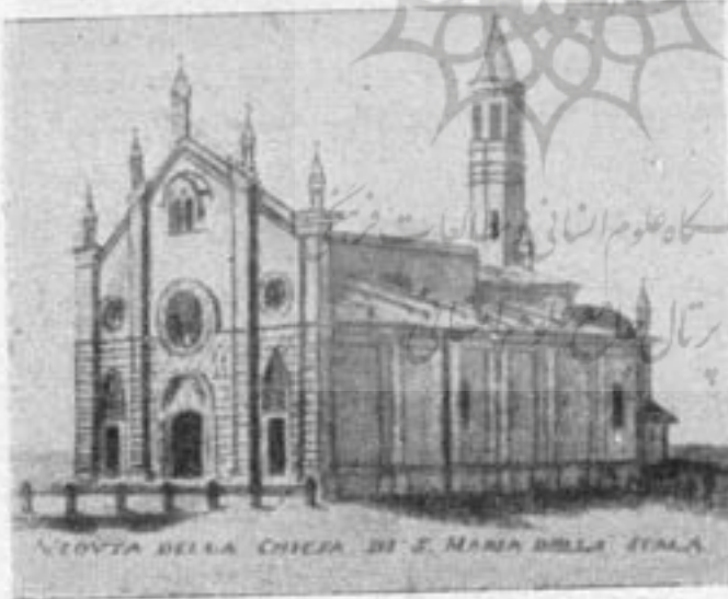
کلیسای سانتا ماریا دلا اسکالا

مردم ایتالیا چنان به اپراهای ملی خود دل بسته اند که «نوآوری» در اسکالا با مشکلات بزرگی مواجه میشود و هر گاه اسکالا تصمیم میگیرد اپرایی جدید، یا اثری غیر ایتالیایی بر روی صحنه بیاورد با انتقاد ناقدان و جنجال اهالی روبرو میشود. همین