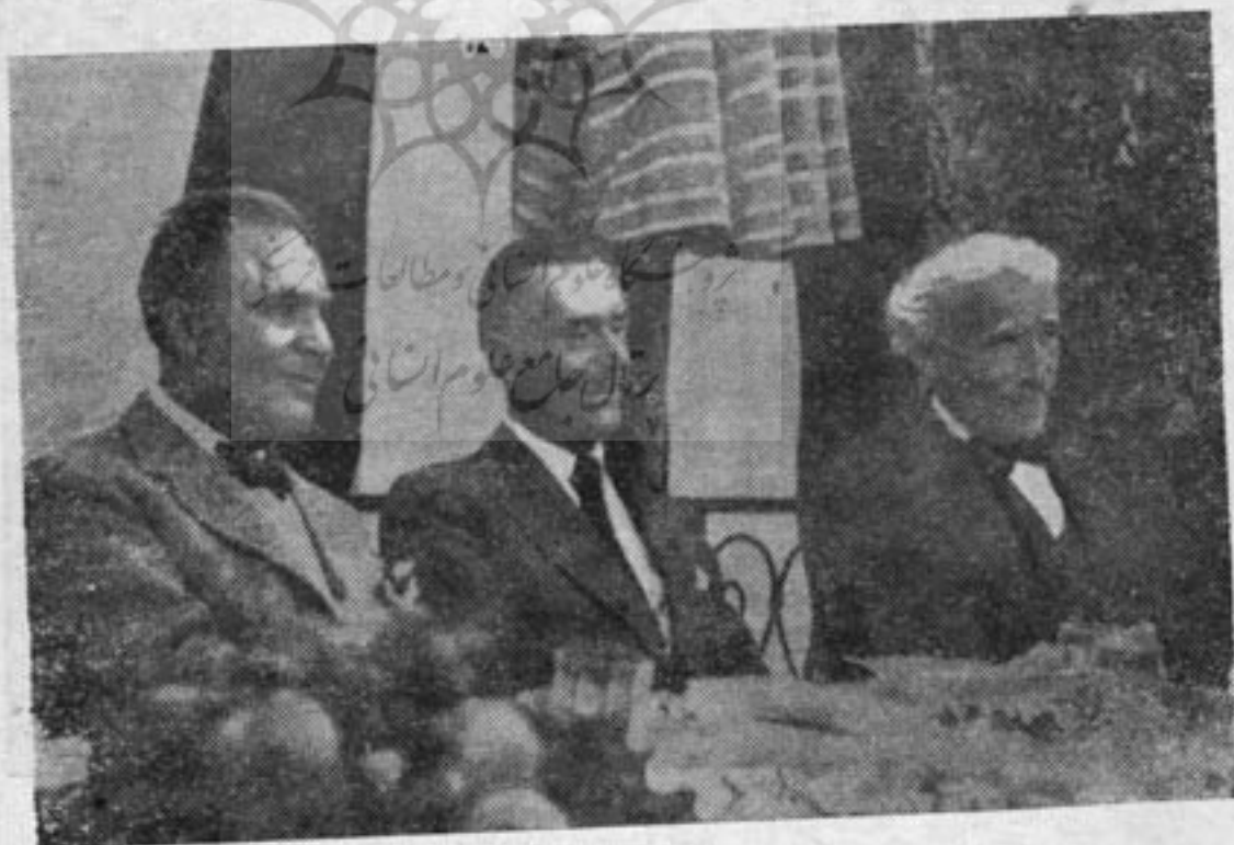
توسکانی نی - برونو والتر - توماس مان

برخی از رهبران ارکستر ابرای وین قبل از جنگ دوم جهانی بقراردیرند :