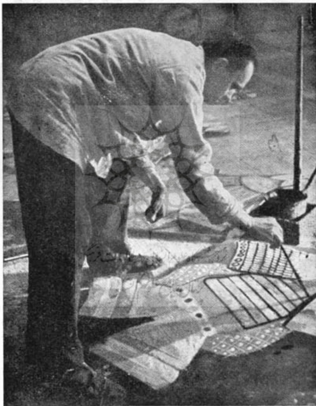
« دکوراتور » لباس

مقوا، کاغذ، طلق، تکه‌های تخته و پارچه مخمل یا ابریشم تهیه می‌شود. در مرحله بعد مدیر فنی اوپرا روی «ماکت» مزبور مطالعه می‌کند و اشکالات فنی یا مالی را طی گزارشی با اطلاع مدیر اوپرا می‌رساند و پس از رفع آن «ماکت» را به کارگاه «دکوراسیون» می‌فرستد و مرحله اصلی تهیه دکور اوپرا آغاز می‌گردد. در کلیه اوپراهای جدید محل وسیعی برای دکورسازی در نظر گرفته شده است.