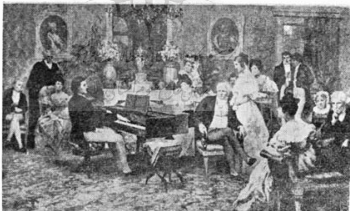
شوپن در حال فواختن پیانو در یکی از مجالس اشرافی

شوپن مدت کوتاهی نزد مادر خوانده خود مادام «آناویزیولووسکا» و یک هفته نزد شاهزاده «آنتوان رادزیویل» در قصر آنتونن اقامت کرد. شاهزاده خانم «الیز رادزیویل» دو طرح مدادی از صورت شوپن ترسیم نمود. همچنین نقاشی بنام «میروزوسکی» دو تابلو از پدر و مادر شوپن تهیه کرد.