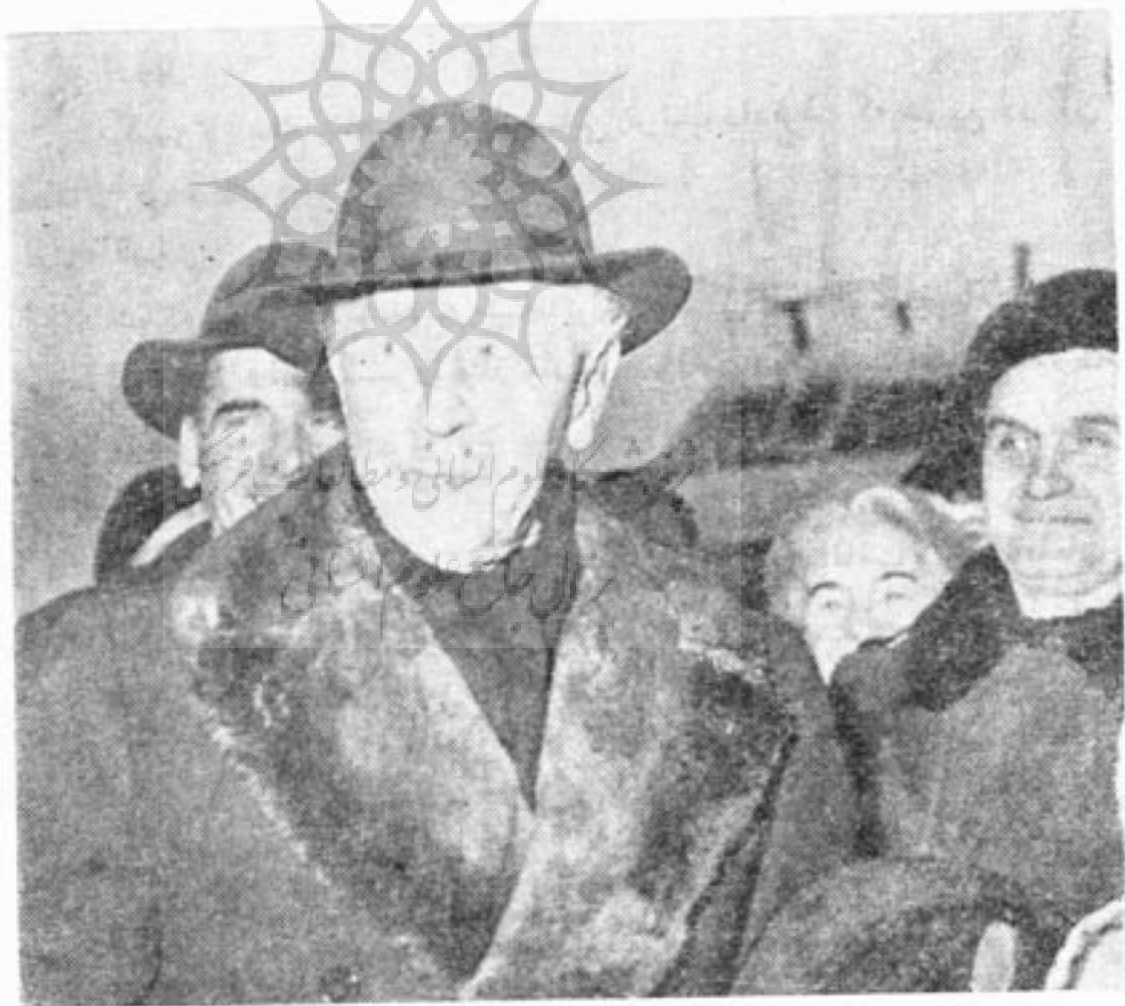
در ۱۴ فوریه ۱۹۶۰ « آرتور روبنشتین » برای داوری افتخاری در ششمین کنکور بین المللی شوپن وارد ورشو گردید

مجموعه ای از آهنگهای شوپن از قبیل : گراند فانتزی در لا ماژور