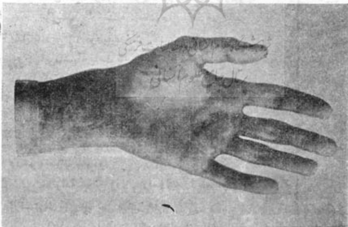
قالب دست «شوین»

دیری نپائید که خانه آنها مرکز استادان، نویسندگان، نوازندگان، نقاشان و بازیگران تئاتر شد .