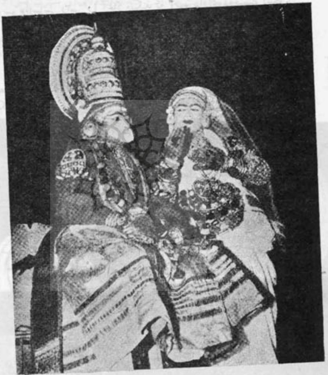
شیوا و پارواتی در رقص کاتا کالی

بزرگ که بیست سیر هندی روغن بگیرد روشن میکنند . از کستر از چهار خواننده و چند طبل زن تشکیل میشود . طبلها بزرگ و کوچک است که صداهای مختلف دارد . وینا و نی و سازهای دیگر هم بکار میرود . پس از اینکه