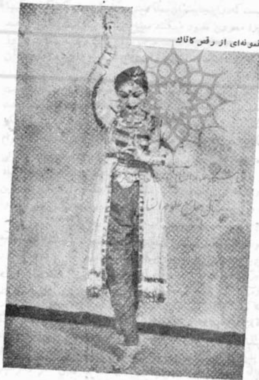
نمونه‌ای از رقص کاتاک

نظیر همان روشی که در رقص مخصوصی بنام استپ (Step) اروپائی متداولست. گاهی هم دستها حرکات شدیدی دارد مانند حرکات شناگران ومشت زنان، ولی این حرکات هرچه باشد معرف بیان حالات واحساسات و مفهوم خاصی نمیباشد وحتی ژستهای معینی که در سایر انواع رقص به پیروی از وزن انجام میگیرد در رقص کاتاک حدود معینی دارد. درحقیقت باید گفت که جنبه هنرنمایی و ورزشی آن بیش از لطف و ظرافتی است که از رقص انتظار میرود وحتی آنقدر این جنبه غلبه دارد که بیننده بجای اینکه مجذوب شود گاهی موجبات خستگی خاطرش فراهم میگردد.