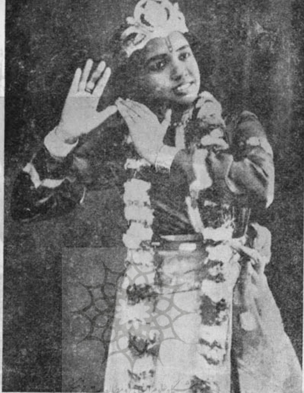
در رقص کاتا کالی آئی اچنتن علی مرالکچیم میکند

است . در میان مردم آن سامان ، رقص کساری مشغول کننده و جزء مراسم مذهبی بشمار میرود . رمز زیبایی حرکات رقصهای مانپور در شوقی است که بطیب خاطر و بصرافت طبع باین هنر دارند . هرچند این رقص از الهامات روحانی سرچشمه گرفته ولی غالب دسته‌هایی که خود را با این هنر سرگرم می کنند احساسات و تهییجات خود را ابراز میدارند . در تمام جشن‌های مانپور اعم از مذهبی و غیر آن موجبی برای رقص پیش می‌آید . در شب‌های مهتاب هر موقع از سال که باشد جوانان در حال رقص از قریه‌ای بقریه دیگر میروند و همواره بر عده آنها افزوده میشود . داستان عشق