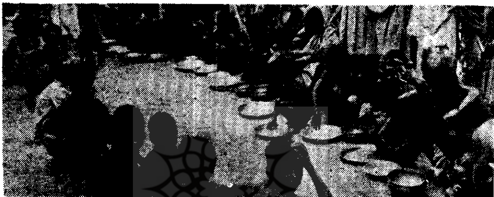
در انتظار غذا ثانیه شماری میکنند . . .

سازمان خوار و بلاد و کشاورزی جهانی میزان غذای متوسط روزانه هفتاد درصد از مردم جهان کمتر از ۲۵۰۰ کالری است و حتی این رقم در مورد ۲۴٪ از نفوس روی زمین از ۲۰۰ کالری تجاوز نمی کند . گرچه در جهان امروز به جز در موارد استثنائی قحطی عمومی که باعث مرگ و میر شود از میان رفته